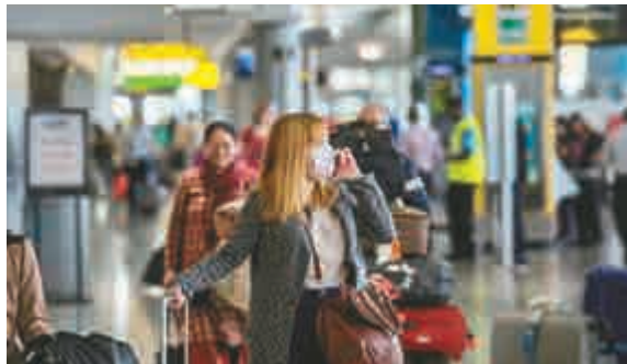
▲一名戴口罩的女乘客8日抵達美國紐約約翰肯尼迪國際機場

白宮發言人厄內斯特8日在例行記者會上表示，這五座機場分別為華盛頓杜勒斯機場、紐約肯尼迪機場、紐瓦克自由機場、芝加哥奧黑爾機場以及亞特蘭大哈茨菲爾德·傑克遜機場。他表示，上述五座機場不僅是全美客流量較大的機場，西非重症區塞拉利昂、利比里亞和幾內亞三國的乘客，有94%的人通過這五座機場入境，每日入境人數約為150人。