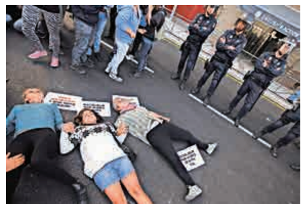
▲西班牙示威者7日躺在地上，抗議當局將感染伊波拉的女護士的愛犬人道毀滅

殯儀館員工也要穿上全套防護裝備，死者遺體可以直接火化，或者放入完全密封式棺材入殮後安葬。家屬如果要為死者舉行告別式，美國疾控中心規定，必須等到遺體放入完全密封式棺材之後，棺木才算完成安全程序，可以停放在葬禮上。