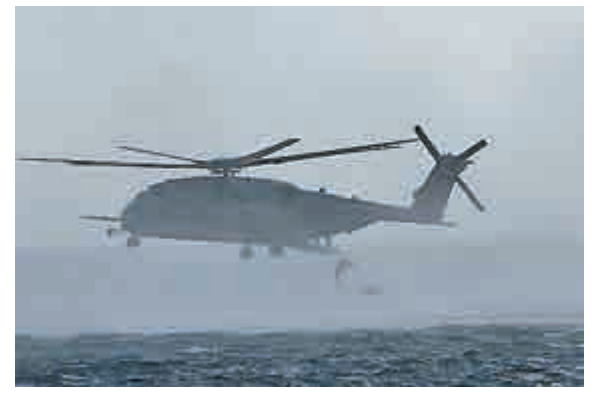
▲日本自衛隊士兵7月在美國夏威夷海軍基地利用美軍直昇機進行演習

日本外務省則表示，已開始通過大使館等渠道向中韓兩國說明，還計劃向澳洲及東南亞各國介紹報告新指針的內容。