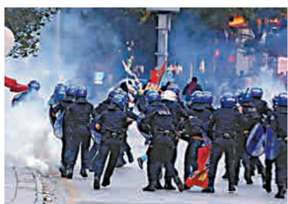
▲土耳其警察8日出動催淚彈驅散舉行反ISIS示威的庫爾德人

【大公報訊】綜合法新社、路透社9日消息：土耳其境內支援敘利亞庫爾德人的民眾7日舉行反對伊拉克極端組織伊斯蘭國（ISIS）的示威，但與警方發生衝突導致21人死亡，土耳其軍方隨後在東南部的至少6個地區，開始實施了宵禁。