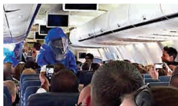
▲一名美國籍乘客聲稱自己感染伊波拉，全副武裝的醫護人員登機檢查

【大公報訊】據英國《每日郵報》10日消息：一名美籍乘客在從美國飛往多米尼加的班機上打了個噴嚏，開玩笑大喊「我有伊波拉！」後，緊急應變團隊從費城趕往多米尼加，全副武裝登機檢查，機上其餘255人被迫多等2個小時。 這名根本沒有罹患伊波拉的乘客，後來宣稱「我不是從非洲來的」，4名處理人員拘留他並把他帶往多米尼加朋達卡納機場的醫學中心。男子說自己有伊波拉後，坐他附近的乘客捂住臉部。 據稱這名男子在全美航空公司這趟4小時的航程中一直打噴嚏、咳嗽。從一名乘客拍攝的影片可以看到，其他乘客紛紛站起身想避開這名男子，空姐則用擴音器請大家坐下，並說「根據我從事這行30年經驗，我肯定這個男的是白癩」。這名男子起身拿行李並在護送下離開飛機時，其他乘客拿手機拍攝，並對他報以噓聲。