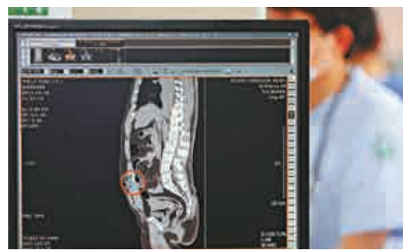
▲韓國醫院公布死亡的中國船長的CT掃描圖，顯示其左側腹部有槍傷，體內還留有子彈殘骸