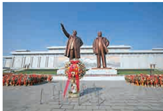
▲朝鮮最高領導人金正恩為勞動黨建黨69周年敬獻的花籃

【大公報訊】綜合英國廣播公司、美國《華爾街日報》10日消息：朝鮮最高領導人金正恩一連37天未公開露面，外界盛傳他抱恙之際，朝鮮官方媒體證實，金正恩10日未參加朝鮮勞動黨建黨69周年的紀念活動。 據朝中社的報道，朝鮮黨政領導幹部星期五前往平壤市郊的錦繡山太陽宮，瞻仰已故領導人金日成和金正日遺容，但報道中的拜謁名單並未包括金正恩，只說金日成和金正日立像前擺放了「金正恩敬獻的花籃」。 較早之前，朝鮮觀察人士目前正在密切關注金正恩是否出席當天的紀念活動，因為金正恩從2011年底上台開始，之後的兩年均出席了這一活動。