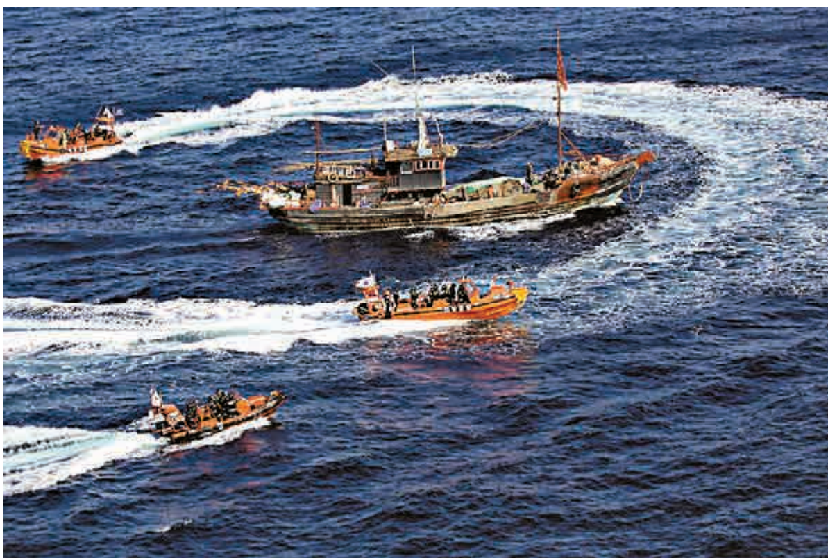
▲10月8日，韓國海警船在黃海包圍一艘涉嫌「非法」捕魚的中國漁船

目前事發漁船正在拖往韓國港口，其確切身份仍待核實。據中國內地媒體報道，涉事漁船的船號可能屬於偽造。北京《新京報》報道稱，山東省海洋與漁業廳工作人員對其記者稱，魯營漁50987號船號「是假的」；山東省漁政處和港監處人員證實，在山東省船舶檔案中查不到此船號的相關信息。港監處人員說：「是遼寧的船，還是山東的船，我們也在調查了解。」 《新京報》還說，據漁業廳信息中心處工作人員介紹，赴韓國捕撈的山東船隻不少，也曾發生過「冒名」山東的漁船在韓國捕撈事件。