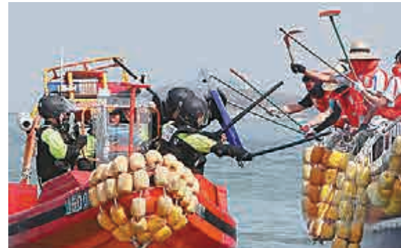
▲韓國海警進行打擊非法捕魚模擬演習