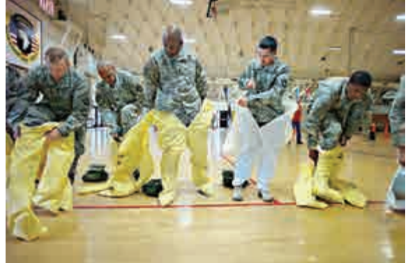
▲準備派駐西非協助控制伊波拉疫情的美軍士兵，9日在肯塔基州的坎貝爾基地試穿防護服

【大公報訊】綜合法新社、中央社10日消息：伊波拉疫情出現向全球蔓延趨勢，歐美多國大為緊張。馬其頓衛生官員說，一名疑似患上伊波拉的英國人9日在當地死亡，但當局強調，相關樣本已送德國實驗室分析，