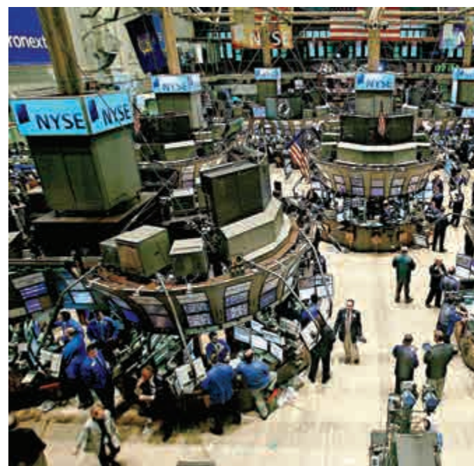
▲全球股市自從上月升至歷史高位以來，至今市值已蒸發了3.5萬億美元

亞股下跌，反映區內股市走勢的MSCI 亞太區指數會跌1.6%，至136.47，原因是投資者憂慮歐洲經濟放緩而導致美股周四晚大跌，加上香港的「佔中」行動持續。CMC Markets 倫敦的市場分析員 Jasper Lawler 認為，歐洲仍然身陷險境，股市的市值已升至超高水平，投資者現正憂慮區內的公司會受到任何壞消息影響而盈利受過。