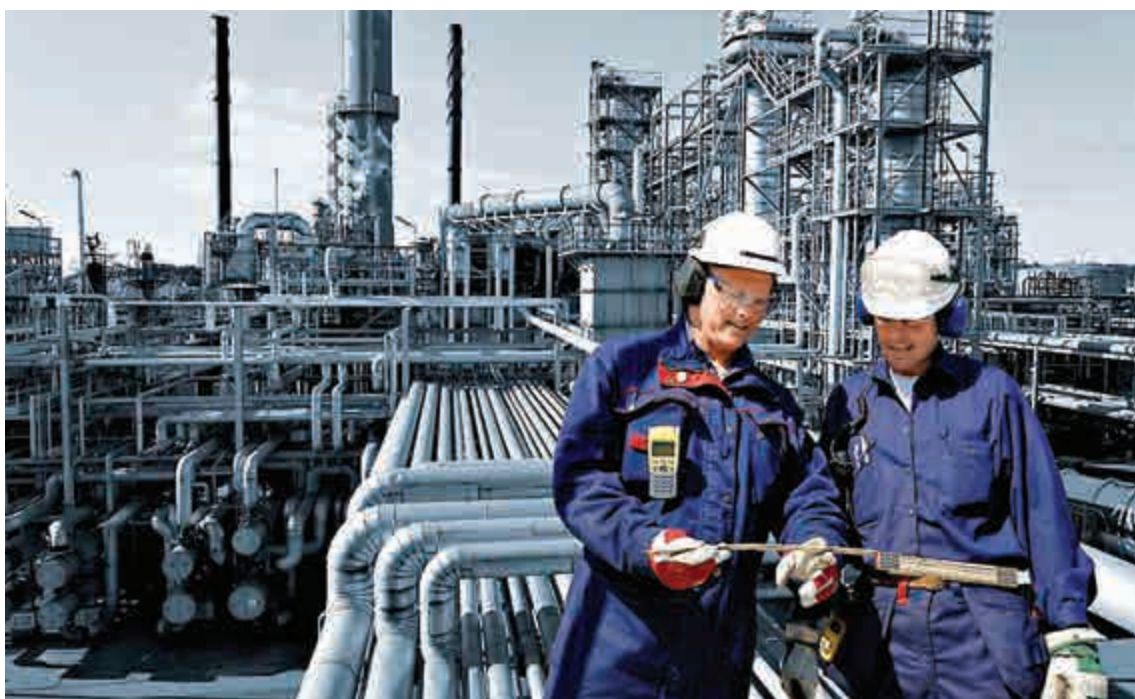
▲全球兩大交投最活躍期油市場下挫，原因是石油供應充足

彭博進行分析員調查顯示，石油輸出國組織佔全球石油供應約40%，上月每天產量3093.5萬桶。油組12國成員國將於11月27日召開會議，分析員料可能宣布減產，估計或每天減產50萬至100萬桶。國際貨幣基金組織10月7日調低2015年全球經濟預測，國際能源局亦下調今明兩年石油需求預測，油市分析員和交易員預料，下周美國油價將會持續下滑。悉尼CMC市場策略員表示，油市料進入調整階段，其中一個跌市觸發點是沙特阿拉伯減價促銷，投資者推測油組或考慮跟隨。