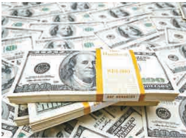
▲美元指數在連跌三天後，有投資者入市吸納美元

高盛集團認為，基本因素將繼續支撐美元上升，該公司已調整了未來12個月歐元兌美元的目標水平，由原來的1.2調低至1.15。該公司策略員Robin Brooks表示，美元的強勢仍在。