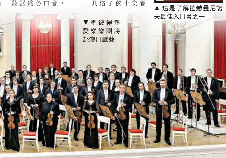
▼聖彼得堡愛樂樂團將赴澳門獻藝