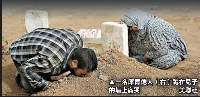
▲一名庫爾德人(右)跪在兒子的墳上痛哭

目前，聯合國預計，在科巴尼還有約700名居民，主要都是老年人，附近地區還有約13000人被ISIS控制，「一旦科巴尼淪陷，這些人都將被屠殺」。