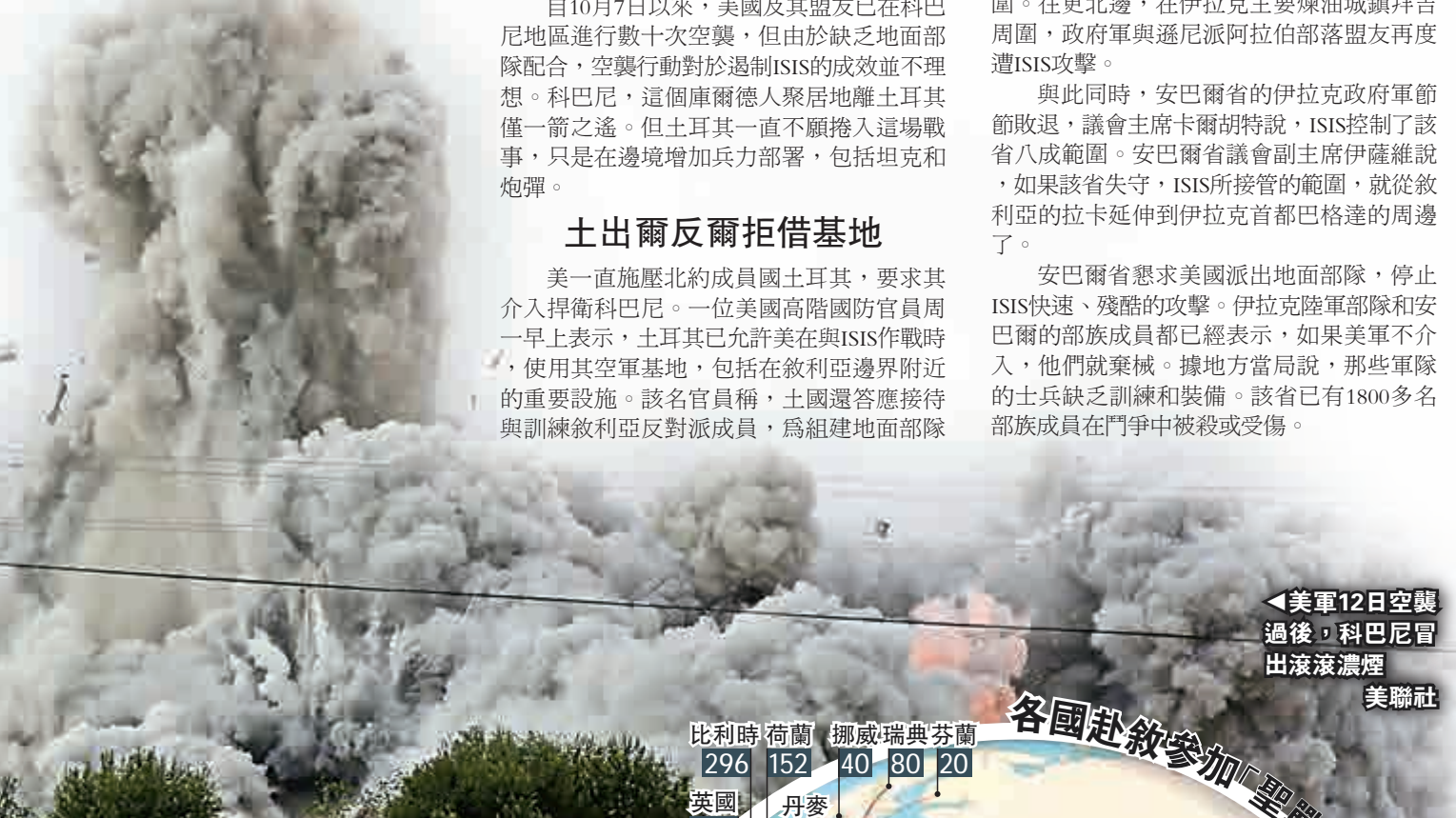
各國赴敘參加「聖戰」人數

孟加拉、智利、科特迪瓦、日本、馬來西亞、馬爾代夫、新西蘭、菲律賓、塞內加爾、新加坡及特立尼達和多巴哥等國也有國民參戰