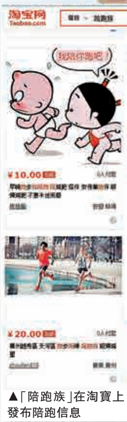
▲「陪跑族」在淘寶上發布陪跑信息