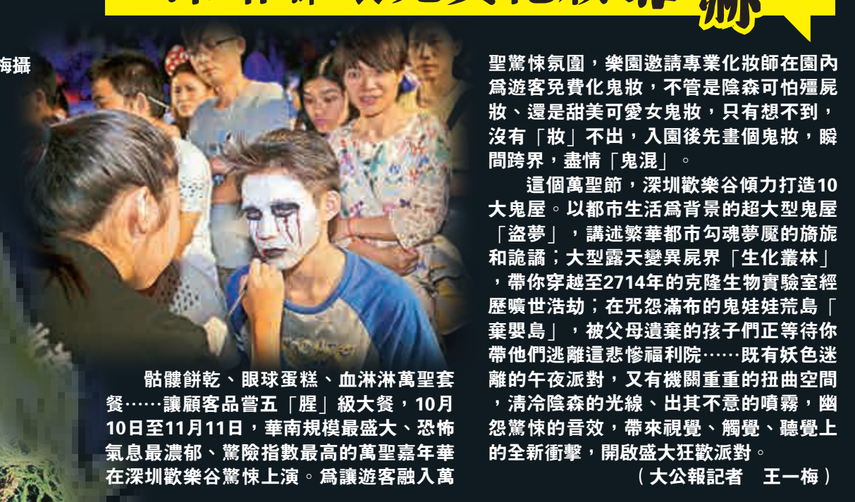
骷髏餅乾、眼球蛋糕、血淋淋萬聖套餐……讓顧客品嚐五「腥」級大餐，10月10日至11月11日，華南規模最盛大、恐怖氣息最濃郁、驚險指數最高的萬聖嘉年華在深圳歡樂谷驚悚上演。為讓遊客融入萬

聖驚悚氛圍，樂園邀請專業化妝師在園內為遊客免費化鬼妝，不管是陰森可怕殭屍妝、還是甜美可愛女鬼妝，只有想不到，沒有「妝」不出，入園後先畫個鬼妝，瞬間跨界，盡情「鬼混」。