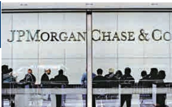
▲摩通為法律相關開支撥備10億美元，每股收入因而減少26美仙

國際能源組織周二把今年全球石油需求每日調低25萬桶，明年需求則日減9萬桶，消息導致布蘭特原油期貨價格曾跌至每桶87.59美元，為自從2010年12月以來最低水平。紐約期油亦曾跌1.01美元，每桶跌至84.73美元。