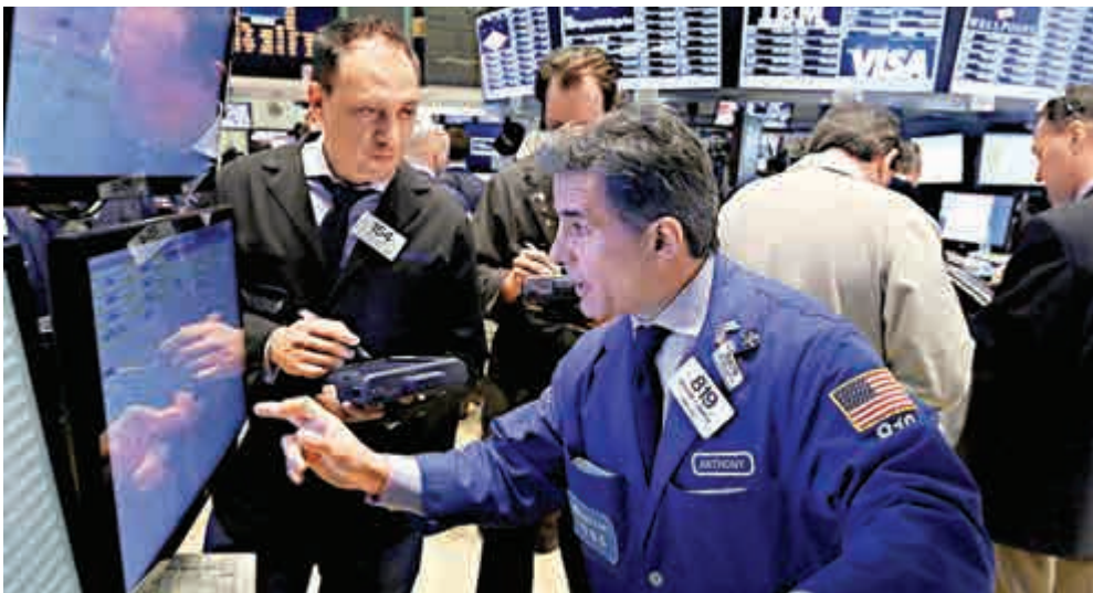
◀市場揣測美國加息步伐減慢，美國國債上升，美股先跌後升

歐洲經濟前景欠佳，打擊企業盈利和投資者信心，歐股繼續下跌。周二歐洲Stoxx 600指數跌0.9%至318.76，為8個月以來最低水平。該指數自10月6日以來跌5.1%。英國最大奢侈品生產商Burberry股價跌4.2%至每股1417