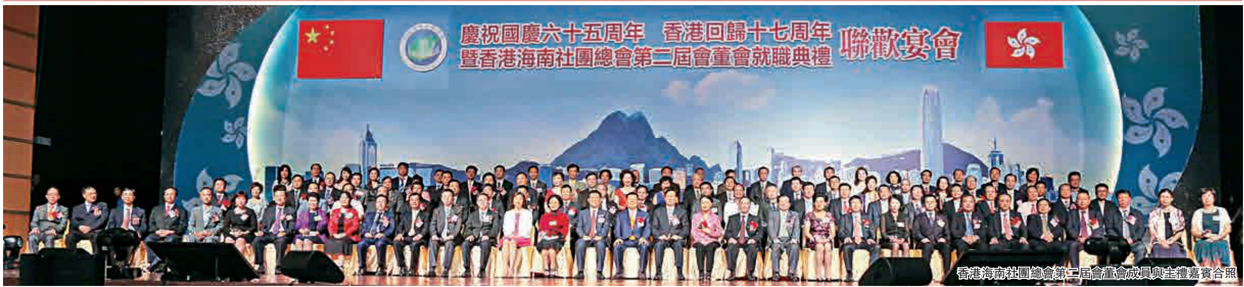
香港海南社團總會第二屆會董會成員與主禮嘉賓合照