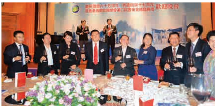
歡迎晚會上，賓主一同祝酒