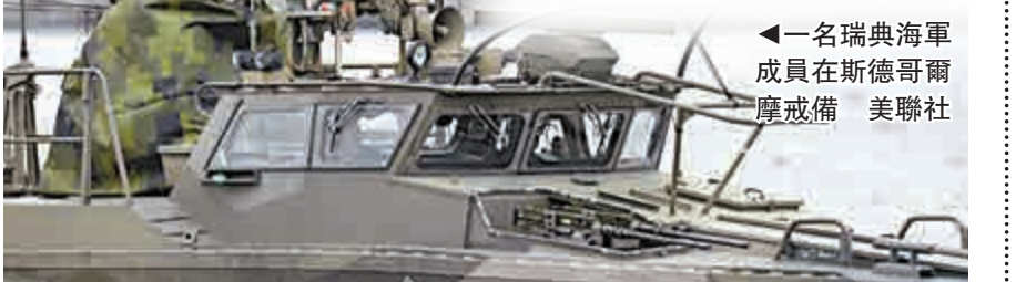
◀一名瑞典海軍成員在斯德哥爾摩戒備

【大公報訊】據路透社斯德哥爾摩18日消息：瑞典18日加強在其斯德哥爾摩群島駐軍，以搜索其水域有沒有「外來的水下活動」，而今次動員瑞典艦船、軍隊和直升機的規模為冷戰以來首見。 今次搜索由17日開始，在離斯德哥爾摩不足50公里的波羅的海進行，喚起了人們對冷戰末年的記憶。當年瑞典多次發現可疑的蘇聯潛艇在其海岸深處。 如今，莫斯科介入烏克蘭危機，以歐盟成員國為主的北歐及波羅的海國家和俄羅斯之間的氣氛越來越緊張。芬蘭上周就曾指控俄羅斯海軍干預芬蘭在國際水域上的1艘環境研究船。