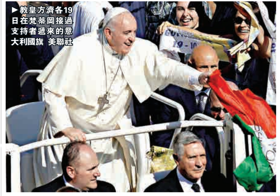
►教皇方濟各19日在梵蒂岡接過支持者遞來的意大利國旗