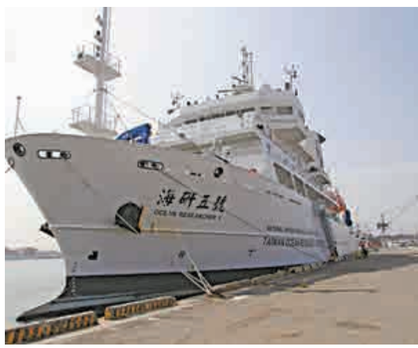
▲台灣「海研五號」研究船10日行經澎湖龍門外海，疑似觸礁，右舷傾斜船艙進水沉沒，最近海象不佳，仍未尋獲沉船

是台灣最新、最先進的海洋探測船，雖然以研究海洋科學為名，但是實際上更肩負一項不為人知的秘密，就是軍事水文蒐集、飛彈參數及彈道偵測任務，在軍事任務上，是一艘不折不扣的「情報船」。