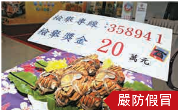
▲苗栗縣出產的優質大閘蟹20日宣布公蟹開賣，為避免仿冒品混淆消費市場，縣府祭出新台幣20萬元獎金，鼓勵民眾檢舉