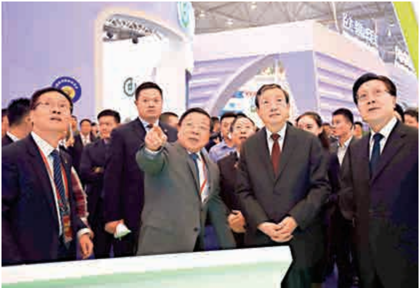
▲馬凱（右二）在開幕式前考察西博會西部合作館

馬凱說，中國西部國際博覽會暨西部國際合作論壇開辦以來，已成為展示中國西部地區經濟社會發展的重要窗口、促進西部地區對外經貿合作的重要平台。特別是近五年來，西博會國際化、專業化、市場化的水平不斷提升，已有36萬人蒞臨，累計簽訂投資項目6500餘項，投資總額達3.9萬億人民幣，實現貿易成交額9800億元人民幣。據悉，中國西部投資說明會暨經濟合作項目簽約儀式已連續舉辦7屆。