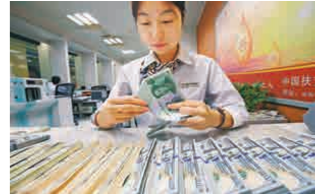
▲人民幣即期匯價低開高走，收報6.1172元，再創八個月新高

有股份制行交易員稱，昨日大行購匯不排除是央行入市干預的可能，11月即將召開APEC(亞太經合組織)會議，中國央行或不希望人民幣貶值，考慮到這一背景，短期人民幣仍有一定支撐。