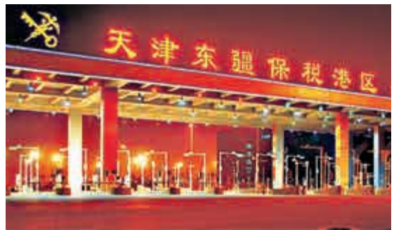
▲據悉，天津市最早申報的自貿區只含東疆保稅港區

申報的自貿區只含東疆保稅港區，第一次申報後國務院給出意見，自貿區可以再擴大範圍，為未來發展留空間。」