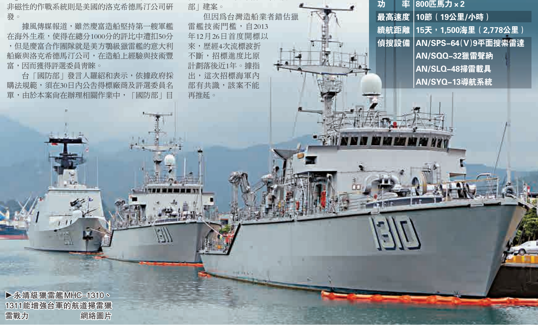
▶永靖級獵雷艦MHC-1310、1311能增強台軍的航道掃雷獵雷戰力