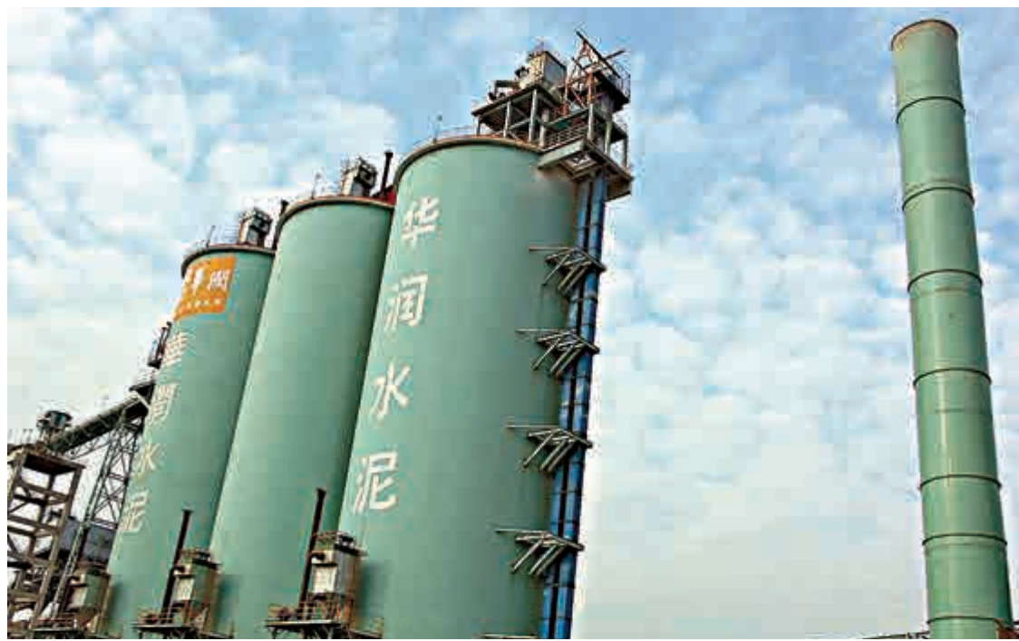
▲華潤水泥截至今年9月底止9個月，純利上升51.98%至32.56億元

今年首9個月，收入增加21.16%至59.58億元（人民幣，下同），水泥與熟料合共銷售2131萬噸，較去年同期增加16%，預計今年全年公司各類水泥產品銷售可達3000萬噸以上。第三季業績方面，收入按年增加17.72%至20.48億元，較上季減少11.23%。