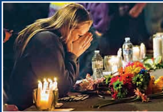
▲學生自發為受害者追悼