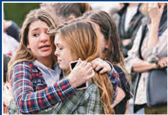
▲兩名女生因槍擊事件受驚，在跑到安全處後相擁安慰對方