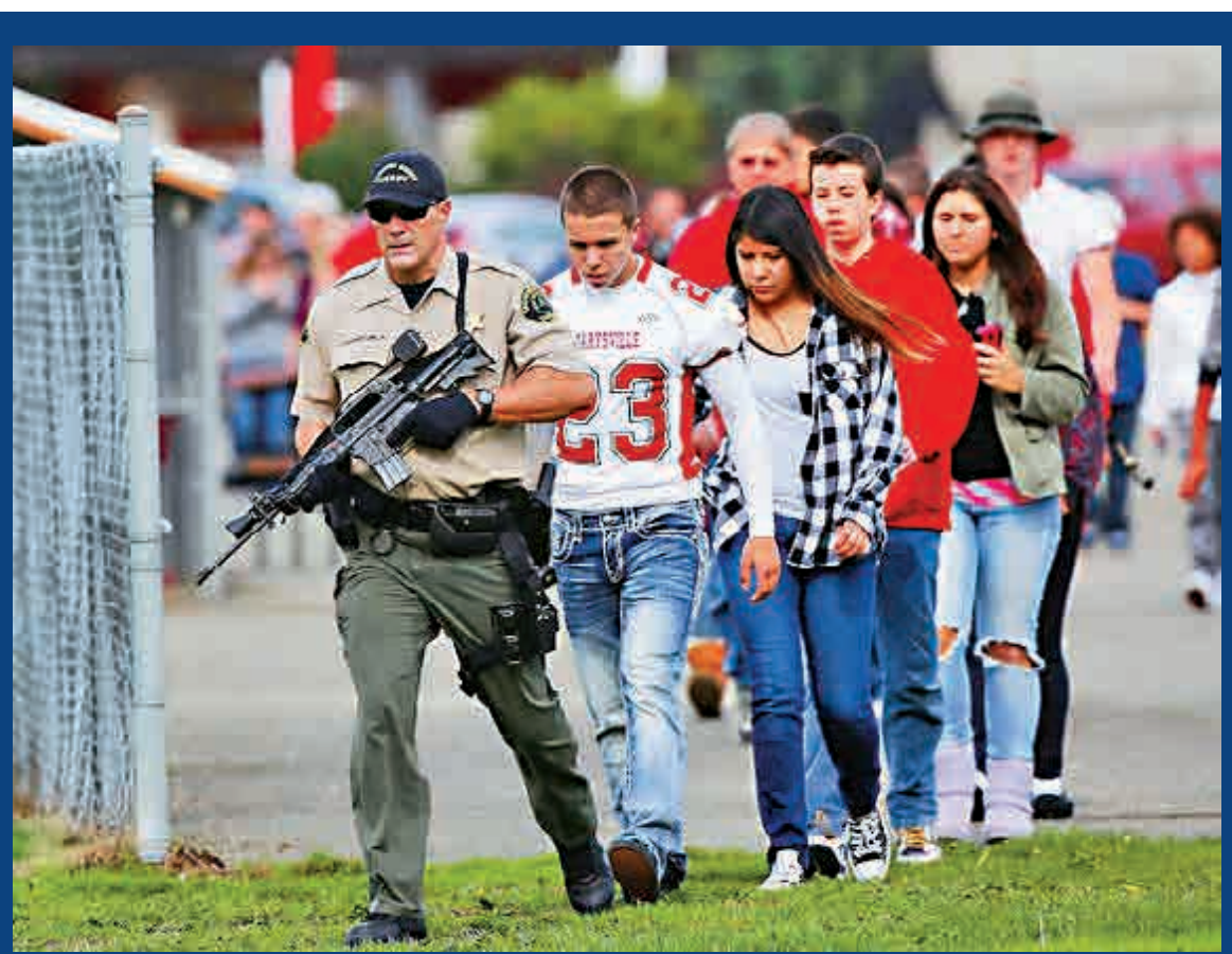
▲學生在警察的帶領下離開危險地帶

這是美國華盛頓州今年內第2宗校園槍擊案。6月，1名26歲男子在西雅圖太平洋大學持彈衝槍開火，造成1名學生死亡，2人受傷。