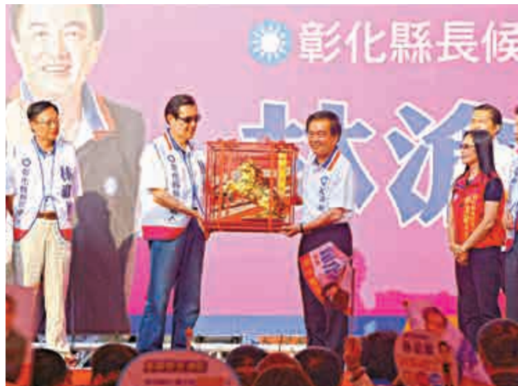
▲馬英九(左二)26日南下為同黨籍彰化縣長參選人林滄敏(左三)站台

【大公報訊】台灣「九合一選舉」逐漸逼近，選戰倒數1個月。台灣指標民調公司近日公布2014年縣市長選情分析，最受關注的台北選區，柯文哲將大贏連勝文，而包括台北在內的六個直轄市，綠營將奪下4個，國民黨形勢不容樂觀。為全力拉抬選情，國民黨主席馬英九將繼續奮身助選，而面對台北選情低迷，「馬隊長」近日亦將親上第一線，進行搶救「勝文大兵」行動。