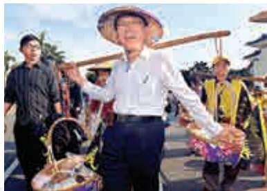
▲柯文哲(上圖)和連勝文(下圖)26日出席「台北客家義民嘉年華活動」，兩人全程零互動