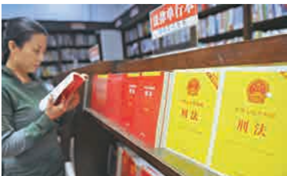
▲10月27日,山西太原書城,民眾翻閱《刑法》書籍

新規要求,檢察院受理實名舉報後,應當對舉報風險進行評估,必要時應當制定舉報人保護預案,預防和處置打擊報復實名舉報人的行為。實名舉報應當逐件答覆,應當將處理情況和辦理結果及時答覆實名舉報人。