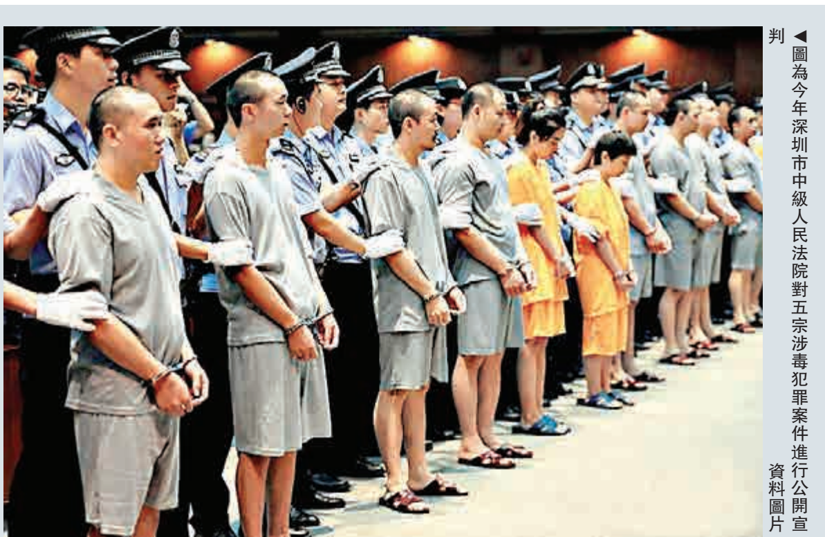
判圖為今年深圳市中級人民法院對五宗涉毒犯罪案件進行公開宣判 資料圖片