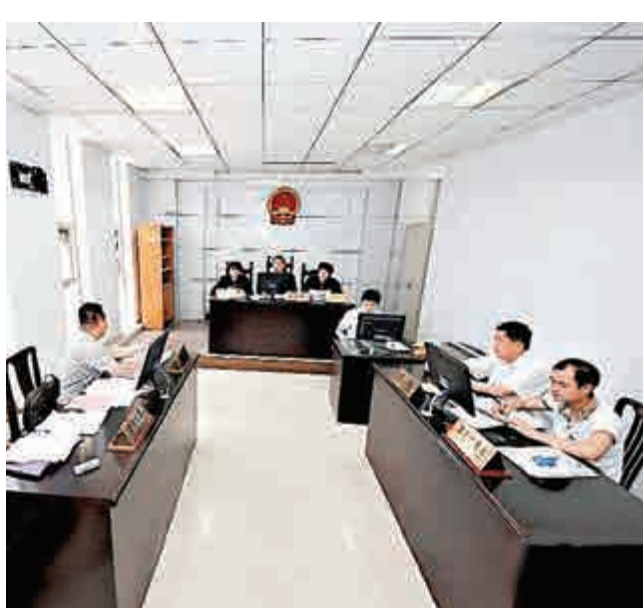
▲圖為東營市市中區人民法院在審理一起「民告官」案件 資料圖片

對於實踐中有的行政機關向行政訴訟原告施加壓力,迫使其撤訴的行為,三審稿中規定了相應的法律責任。喬曉陽表示,法律委員會經研究,規定以欺騙、脅迫等非法手段迫使原告撤訴的,將予追責。此外,三審稿還進一步完善管轄制度,明確了對民事訴訟法有關規定的適用等。