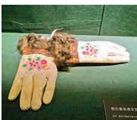
▲鄂倫春族繡花應皮手套 ▼觀衆在現場參觀展品