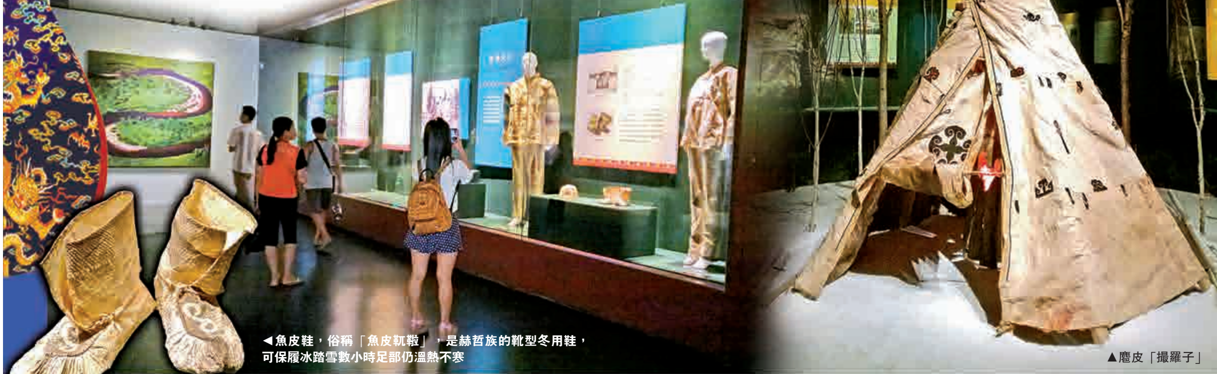
▲魚皮鞋，俗稱「魚皮靴」，是赫哲族的靴型冬用鞋，可保履冰踏雪數小時足部仍溫熱不寒