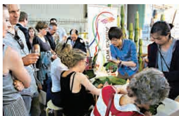
▲項目活動之一，藝術家與參與者互動