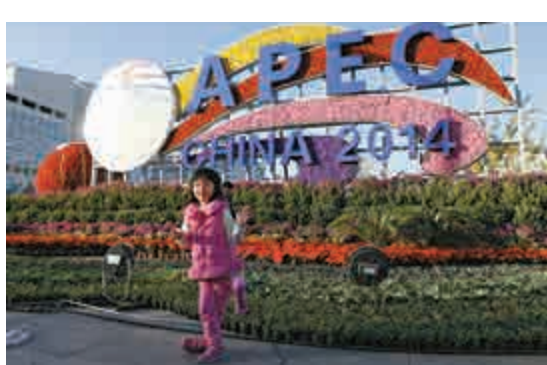
▲市民在北京街頭的APEC主題花壇前拍照留影

加媒表示，哈珀取消參加APEC行程的背景是，在上周之內，加拿大魁北克省和渥太華國會大廈相繼發生恐怖襲擊事件，有兩名軍人先後死於開槍衝突和槍殺，一名軍人和一名警察受傷，尤其是國會槍擊案震驚加拿大。