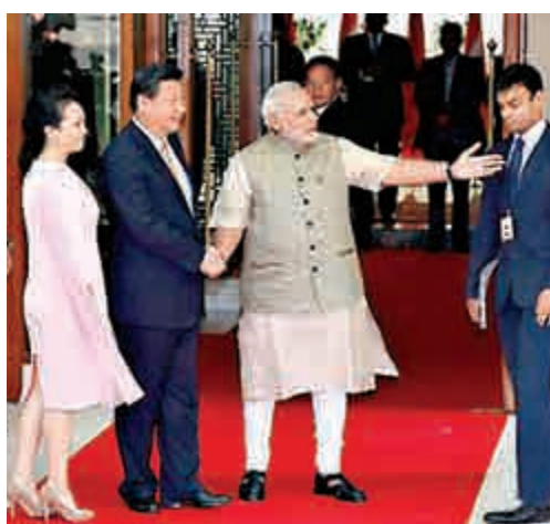
▲9月17日，國家主席習近平在印度會見印度總理莫迪

上並不意味着邀請印度加入APEC組織，因為這需要得到全體會員國的一致同意。「但中國領導人先於美國邀請印度參會，這是習近平所要表達的重要政治信號，標誌着對印度的善意」。