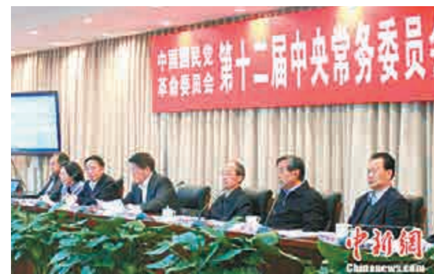
▲28日，中國國民黨革命委員會第十二屆中央常務委員會第八次會議在北京召開 中新網

【大公報實習記者孫琳北京二十八日電】為學習貫徹中共十八屆四中全會精神，中國國民黨革命委員會第十二屆中央常務委員會第八次會議28日在京召開。