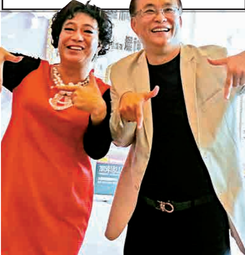
▲阿燦（左）與阿黎尊重無線的決定