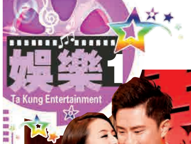
▲林依晨（左）輕吻未婚夫