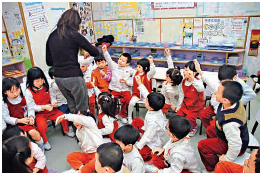
香港的幼稚園與上海比較，校園太小了

話說回來，當然不是每所學校都有這樣的硬體的，很多在上海老區的學校就因為歷史悠久，學校