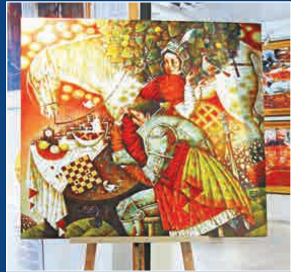
▲Irina Kotova作品《Game》