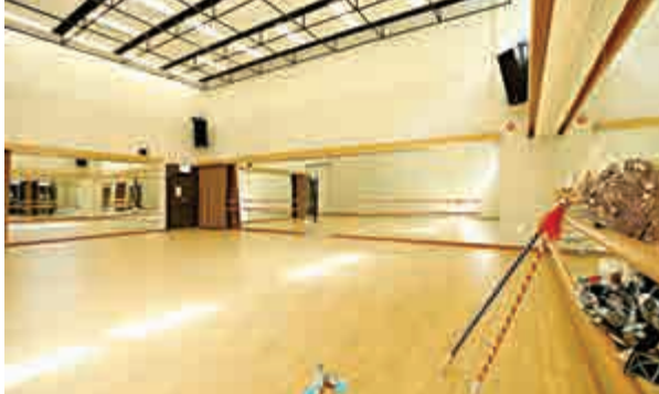
▲專門為戲曲排練而設計的排演室，樓底高達六米