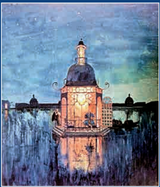
▲Alexander Benois畫作《The Jealous Man, Versailles, The Chinese Pavilion》