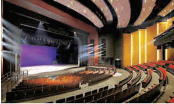
▲設有六百個座位的演藝廳