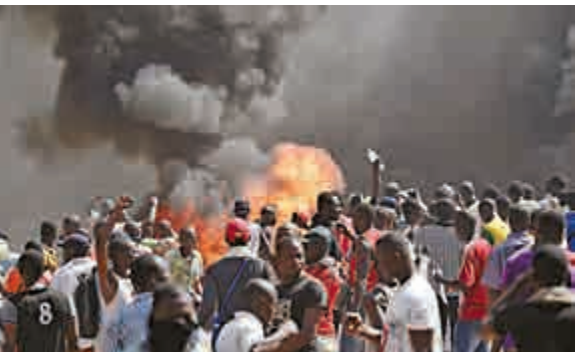
▲布基納法索示威者30日縱火焚燒首都瓦加杜古的議會大廈

美國和法國周四對布基納法索爆發的危機「深表關切」，並且批評布國總統欲修改憲法的意圖。