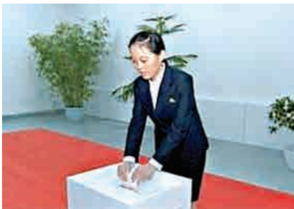
▲金正恩的妹妹金與正

【大公報訊】據韓國《朝鮮日報》30日消息：朝鮮領導人金正恩消失40多天時間裡，傳言妹代兄職的27歲妹妹金與正，最近被傳稱其已經結婚，丈夫是護衛司令部所屬護衛軍官。