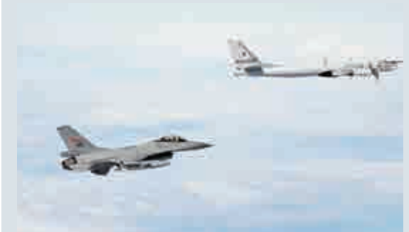
▲挪威空軍的F-16戰機（左）緊急攔截飛入歐洲國際空域的俄圖-95戰略轟炸機

北約位於比利時蒙斯（Mons）的軍事總部表示，包括圖-95「熊」式戰略轟炸機、米格-31戰機在內的4種類型的俄羅斯軍機，於大西洋、北海、波羅的海和黑海上空被探測到的。北約緊急調遣了八個國家的