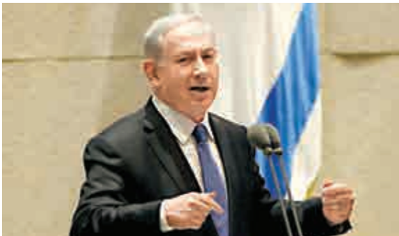
▲以色列總理內塔尼亞胡29日在議會發表講話

聯合國大會在2012年通過決議案，將巴勒斯坦在聯合國的地位由「觀察員」提升為「非會員觀察國」。