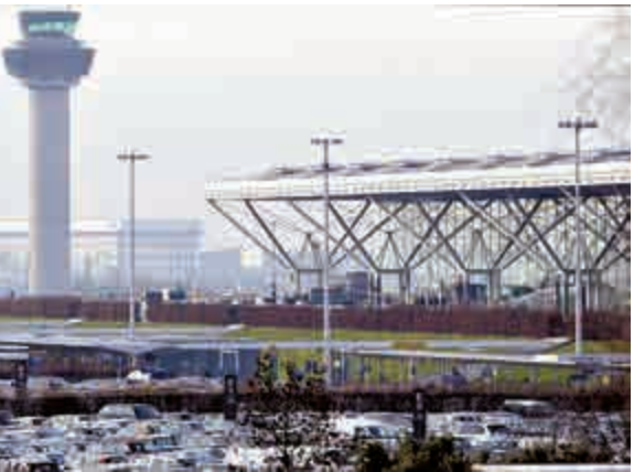
▲拉脫維亞貨機最後在倫敦的斯坦斯特德機場降落