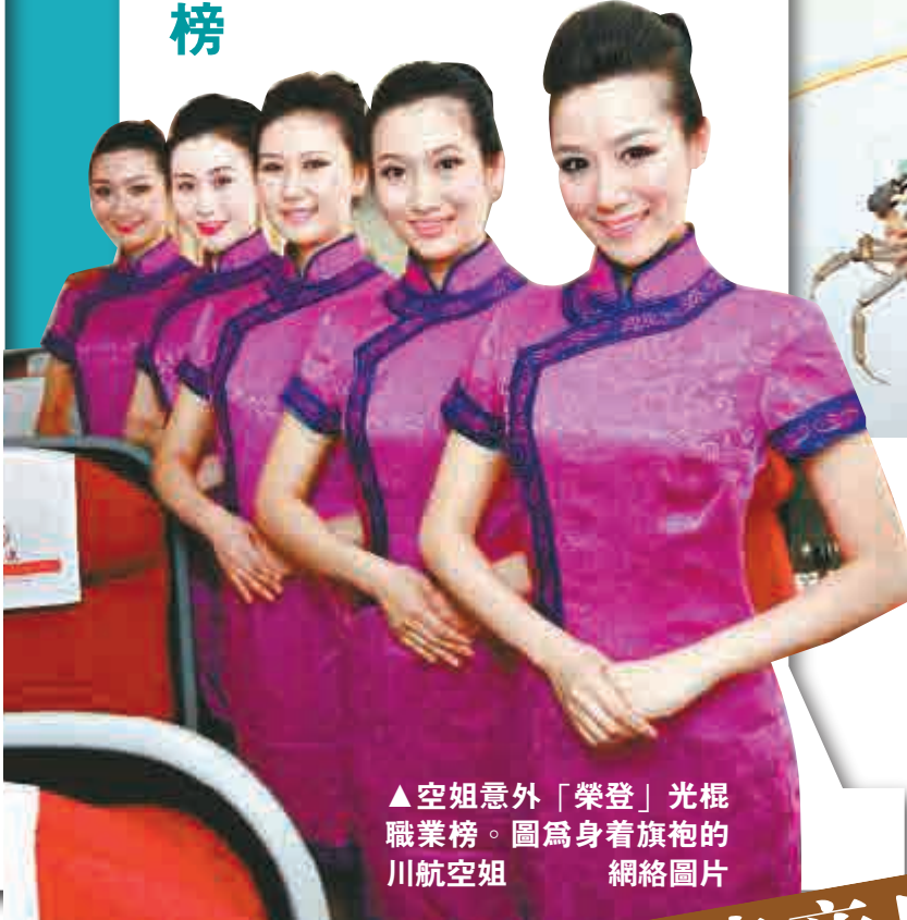
▲空姐意外「榮登」光棍職業榜。圖為身着旗袍的川航空姐