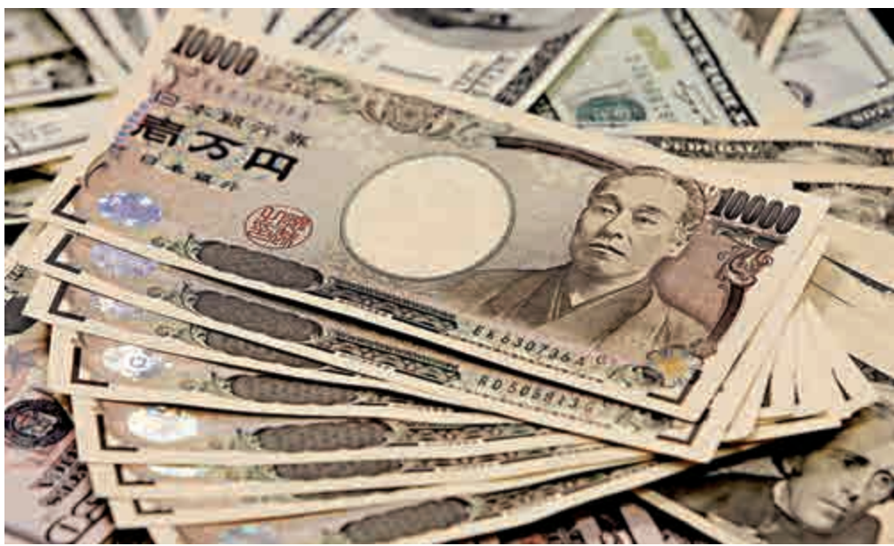
◀日央行上周出其不意擴大寬鬆規模，對全球貨幣市場造成衝擊，並引發亞洲貨幣匯價跟隨貶值