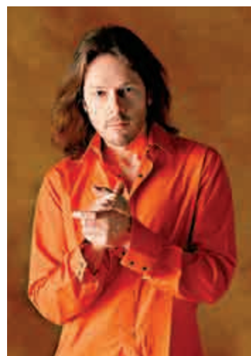
▲法國鋼琴家布拉雷