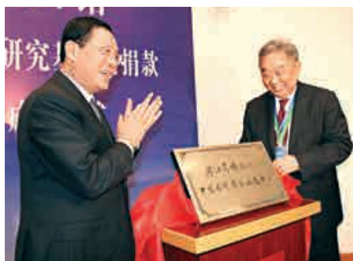
▲浙江省副書記、省長李強（左一）與曹其鏞為中國漆器藝術館揭幕