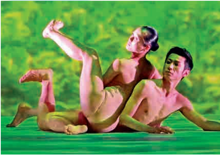
▲舞台上稻田的影像配合舞者圓潤的舞姿