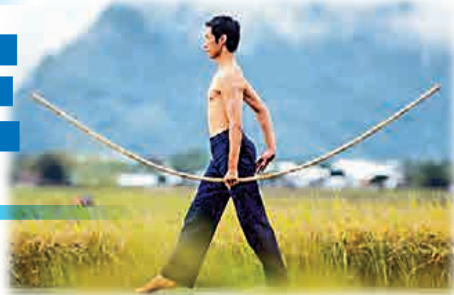
▲《稻禾》取材自台灣稻米之鄉池上的稻田風光