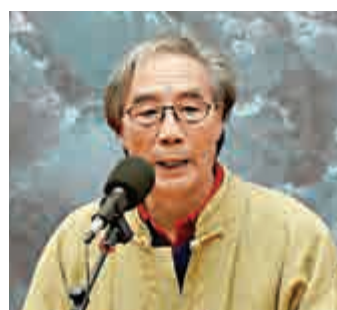
▲宋雨桂在開幕式上講話

【大公報訊】記者李蘭瀟陽報道：國畫家宋雨桂個人藝術館近日在瀋陽落成開放。該藝術館展示了宋雨桂五十年來在不同時期創作的畫作，包括其代表作《麴塵》、《雨荷圖》、《剩海圖》、《長江明珠圖》及《新富春山居圖》等系列作品。同時還展示了他於各地尋訪而得的各類珍貴收藏品。