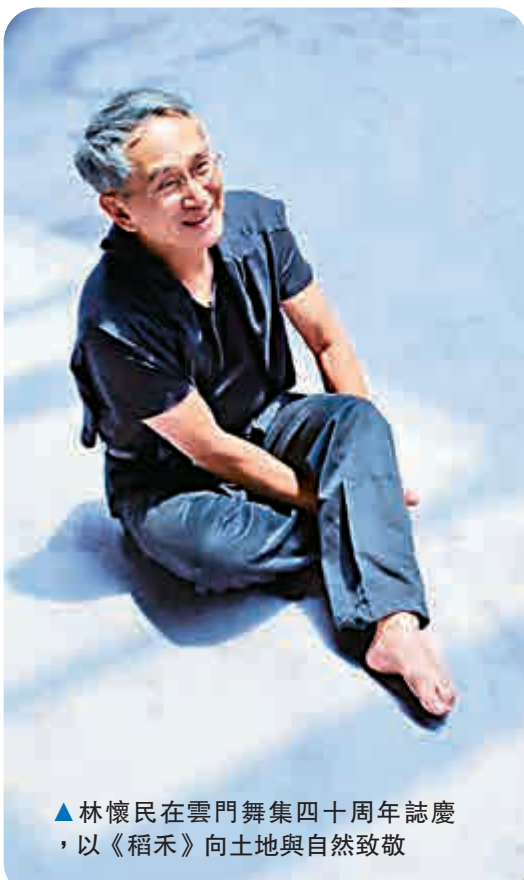
▲林懷民在雲門舞集四十周年誌慶，以《稻禾》向土地與自然致敬

【大公報訊】記者周怡報道：編舞家林懷民本周於香港文化中心大劇院，演出其二〇一三年新創的《稻禾》。取材自台灣稻米之鄉池上的稻田風光，《稻禾》亦是台灣雲門舞集成立四十周年誌慶作品，林懷民更藉此向土地與自然致敬。昨日，雲門舞集示範演出，表演了舞作片段「花粉II」，配樂為聖桑的「夜鶯與玫瑰」選擇「莉莉莎提斯」。