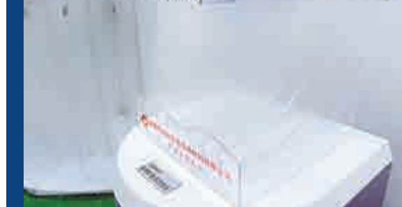
▲蚌埠玻璃工業設計院0.3mm超薄玻璃的成功下線，再次刷新中國玻璃發展的歷史紀錄

，目前廠區六大裝置全部投入運行，循環經濟產業鏈全線貫通，產能超過設計產能的80%。