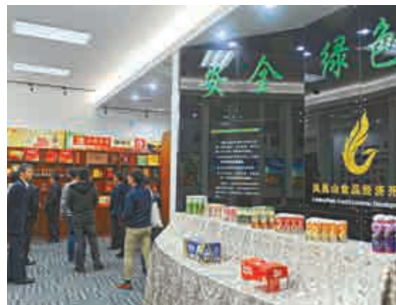
▲「皖北十年看發展」港粵媒體團參訪淮北市鳳凰山食品經濟開發區

安徽省淮北市鳳凰山食品經濟開發區（以下簡稱「鳳凰山開發區」）作爲省內首家省級食品專業經濟開發區，近年來持續推進產業鏈招商，目前共引進食品加工及配套項目100多個，引進內資超百億元（人民幣，下同）。最新統計數據顯示，1至10月，該園區累計完成產值約170億元，超過去年全年總額。