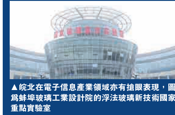
▲皖北在電子信息產業領域亦有搶眼表現，圖爲蚌埠玻璃工業設計院的浮法玻璃新技術國家重點實驗室