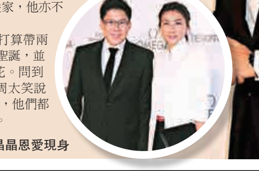
▲啓剛 (左) 與晶晶恩愛現身

聖誕節將至，周國豐和太太打算帶兩個小朋友去澳洲過一個熱辣的聖誕，並希望看到悉尼橋的新年倒數煙花。問到小朋友坐長途機會不適應？周太笑說，正因為之前帶他們去英國旅行，他們都很乖，所以才有今次的澳洲之旅。