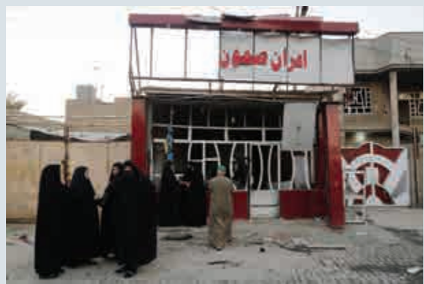
▲巴格達8日遭遇多起連環爆炸，造成至少27人死亡、96人受傷。