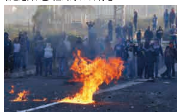
▲以色列籍阿拉伯人8日在以色列北部卡納村附近遊行示威。