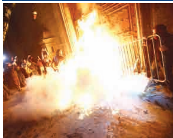
▲墨西哥城的示威者8日試圖衝入國家宮，並燒燒國家宮木門。路透社

【大公報訊】綜合路透社、法新社9日消息：墨西哥政府日前公布43名學生失蹤案調查的重要進展，根據嫌犯供述，當地販毒集團屠殺了這些學生並焚屍滅跡。當地時間8日，南部格雷羅州和首都墨西哥城先後爆發示威遊行。南部示威學生焚燒車輛，而墨西哥城示威者則試圖衝入國家宮，並火燒國家宮木門。