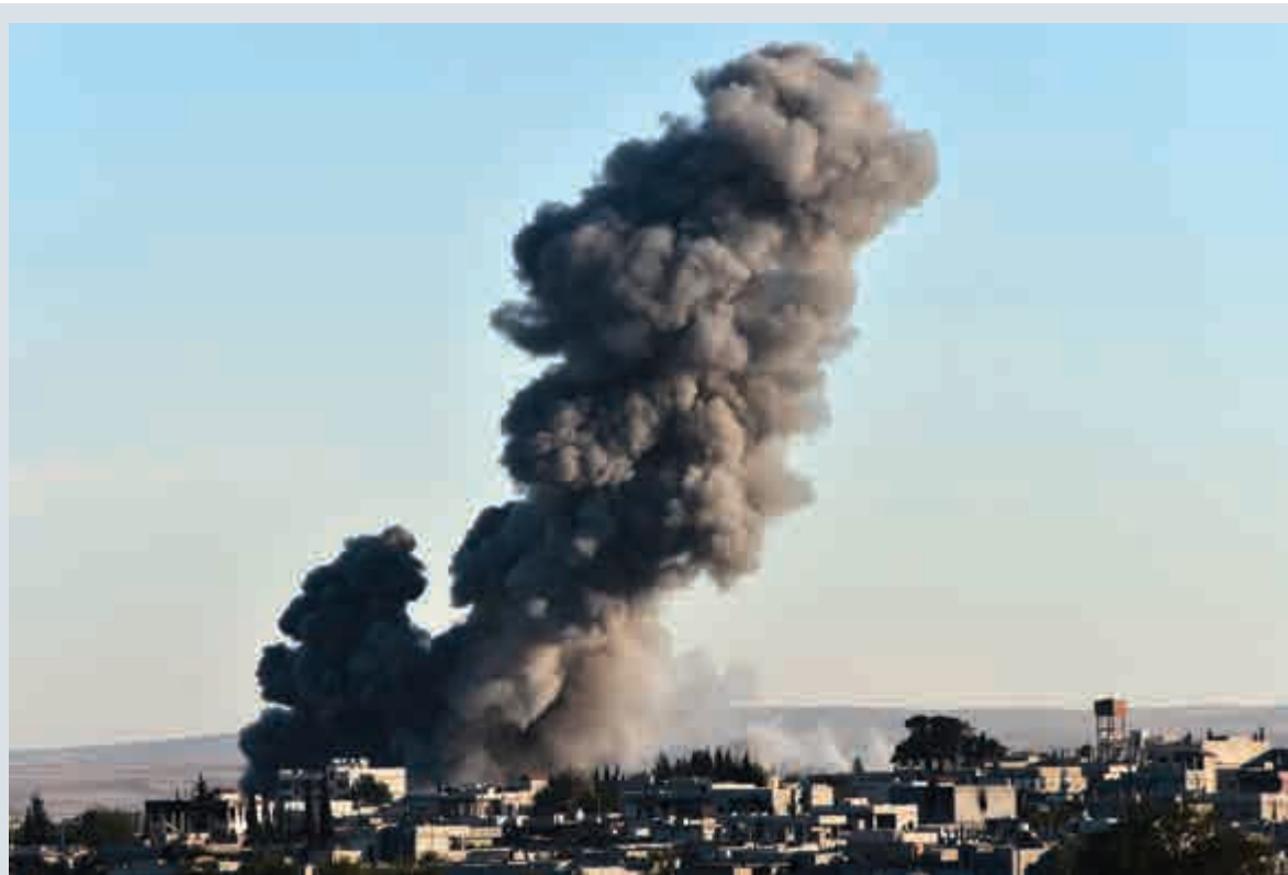
▲美軍8日繼續空襲在敘利亞科巴尼的ISIS武裝分子。

據聯合國伊拉克援助團和人權事務高級專員辦事處發布的公報，今年上半年，伊拉克恐怖襲擊和暴力衝突共導致5576名平民死亡，另有超過1.1萬人受傷。