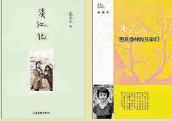
▲ 朱天文散文集《淡江記》記述了創辦三書坊的過程