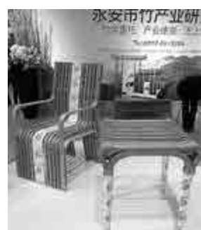
▲林博會上展示的三明永安研發的竹子傢具

林權抵押貸款作為一項制度創新，讓農戶手中的林地資源轉化為資本，盤活了森林資源，拓寬了林農的融資渠道，極大地促進了林業經濟的發展。然而，林業發展也面臨新困境。由於林業經營不僅有自然環境的風險，還有周期長、投入大、見效慢等特點。林權抵押貸款畢竟是一項全新的貸款工作，尚處於探索階段，發展過程中仍面臨諸多困難和問題，需要進一步完善政策配套。首先，隨着近年來農村勞動力外流，山誰管，林誰造等問題日益突出。其次，林業貸款存期限錯配問題。據介紹，林權抵押貸款在