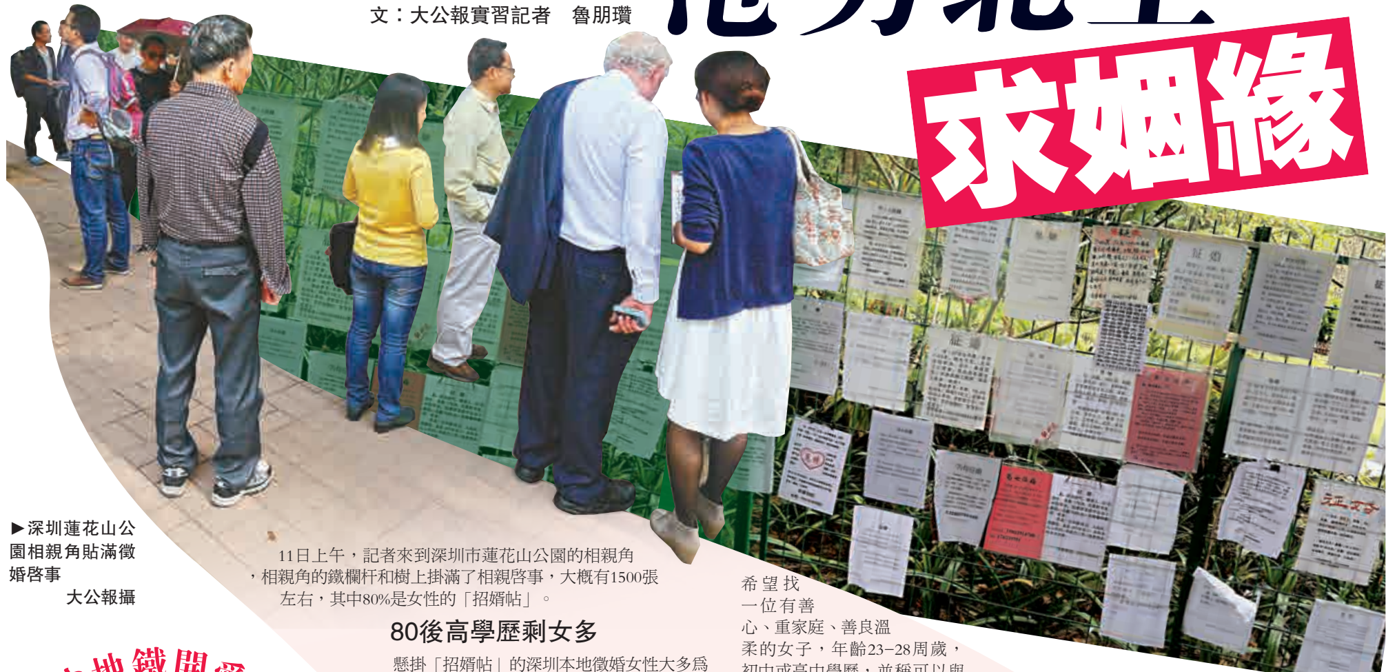
▶ 深圳蓮花山公園相親角貼滿徵婚啟事