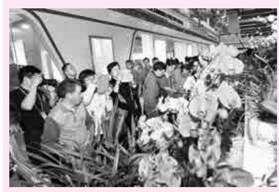
▲三明清流的花卉展區吸引大量市民駐足。目前，三明清流的花卉通過電商，在兩個小時內可以送達國內縣級以上消費者手中

【本報記者何德花報道】為期4天的第十屆海峽兩岸林業博覽會暨投資貿易洽談會9日在福建三明市落幕。據組委會披露，本屆「林博會」共簽訂合同項目143項，總投資193.4億元人民幣。其中，總投資億元以上的項目59項，涉及生物綜合利用產業化、鐵皮石斛種植加工、紅木傢具等。 本屆林博會吸引了來自海峽兩岸的參展企業258