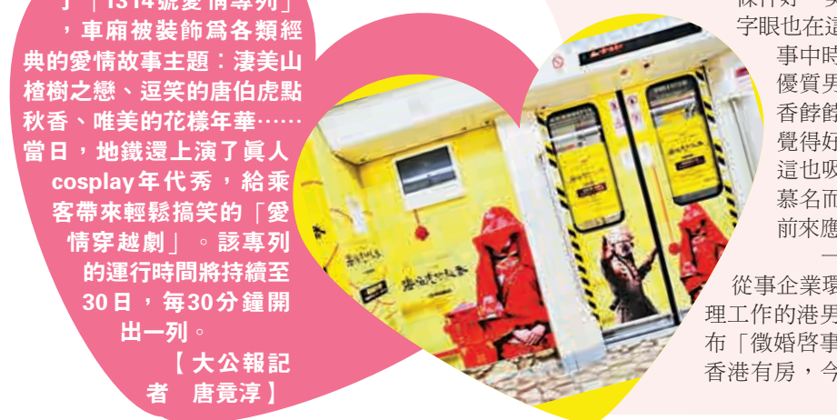
11日上午，記者來到深圳市蓮花山公園的相親角，相親角的鐵欄杆和樹上掛滿了相親啟事，大概有1500張左右，其中80%是女性的「招婿帖」。