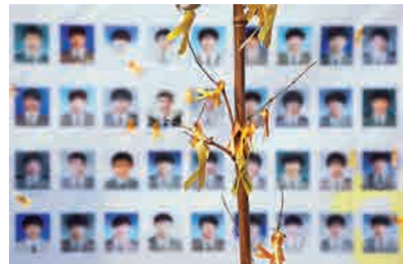
▲首爾街頭貼有「世越」號遇難者的照片牆