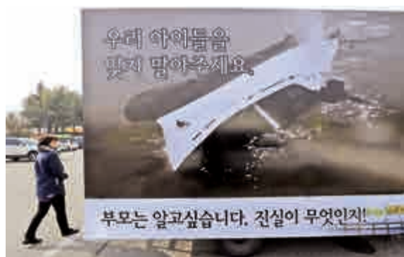
▲一名女子11日經過首爾街頭一個呼籲為「世越」號遇難者尋回公道的告示牌

「世越」號事故引來了一系列針對政府處理救援行動的批評。韓國海岸護衛隊被指救援行動不夠迅速和積極而解散，由新機構取代。由「世越」號催生的三項新法案，上周剛獲韓國國會通過。