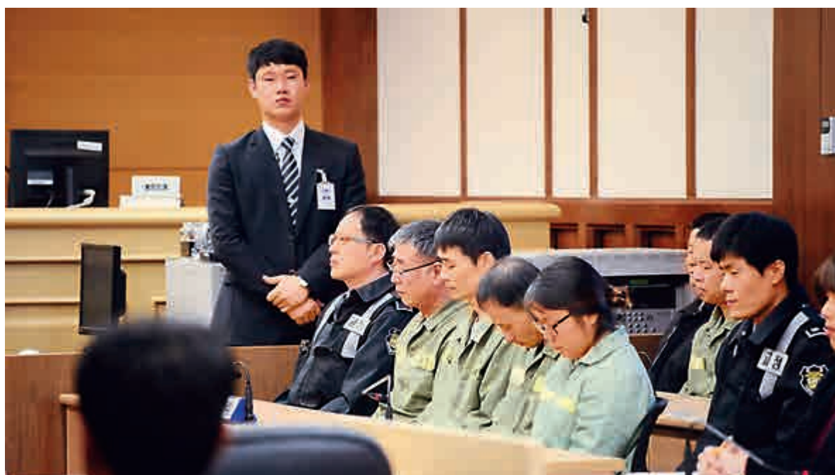
▲韓國光州地方法庭11日對「世越」號船員（穿綠衣服者）作出判決