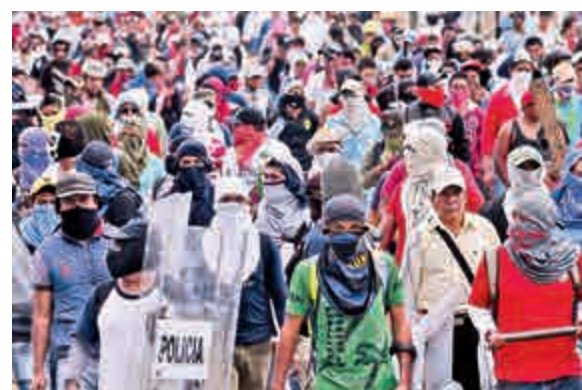
▲蒙面的墨西哥示威者10日在阿卡普爾科進行示威

培尼亞在出發前往中國訪問前表示，不能夠接受示威者藉學生被殺的慘劇訴諸暴力。總統辦公室也否認，第一夫人在購買房產時有任何不妥當地方，她被指接受一間公司資助取得貸款。