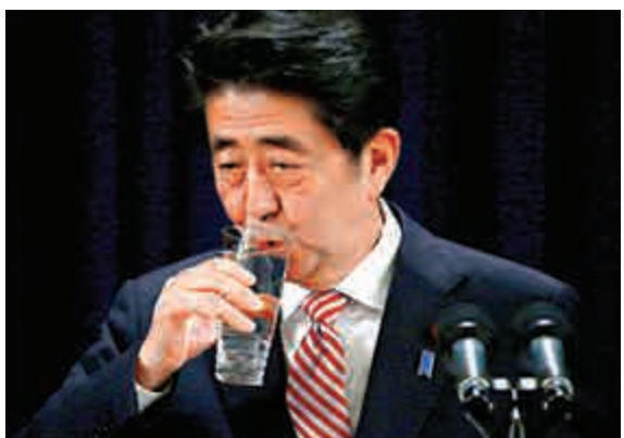
▲日本首相安倍晉三11日在北京APEC峰會論壇上喝水

【大公報訊】據路透社11日消息：日本首相安倍晉三可能推遲在明年提高消費稅的計劃，有可能因此宣布解散眾議院，於下個月提前大選。安倍表示，暫時未決定解散的時間。而與自民黨聯合執政的公明黨11日表示