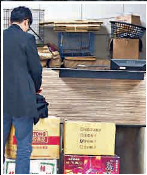
▲調查局人員從綠島監獄查扣4大箱證物，準備運回台北