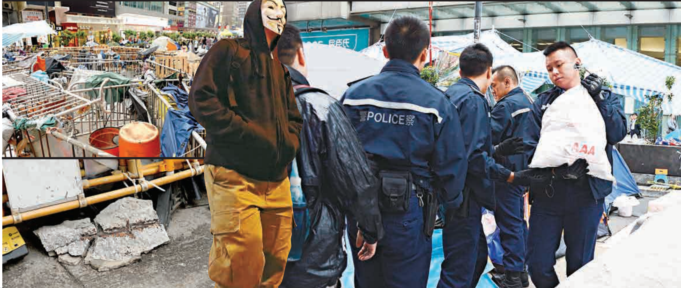
旺角佔領者無視禁制令，不斷加固路障，石塊隨處可見