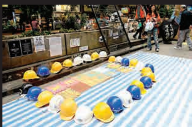
▲佔領者向警方擺出頭盔陣

在金鐘佔領區，夏慤道沿途一帶的帳篷依舊「十室九空」，留守者僅寥寥數人。至於受禁制令範圍內的金鐘中信大廈對開佔領區，仍然留守示威者僅剩大約十數人，而中信大廈外的鐵馬亦只剩下最後一層，早前圍堵大廈出入口的大量鐵馬已被示威者搬走。