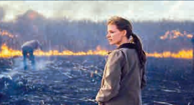
▲為了防止枯萎症，農民惟有燒陷玉米田