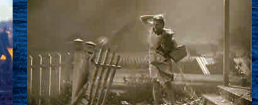
▲《綠野仙蹤》片中描寫的「塵碗」自然現象

致敬黑幫片 黑幫世家死對頭池上和七夕，整天想消滅對家，只是池上偏偏在十年前一次失敗的刺殺中，迷上了仇家的童星女兒美智子。就在這時，七夕那個想做星媽的老婆快要出獄，為了討好老婆，七夕決心捧個女做明星。狂迷獨立片導演開拍美智子擔正的大片，引發一連串癡狂野、半真半假的重口味故事。 這部向黑幫電影「致敬」的電影，由以作品風格怪異的導演園子溫操刀。主角除了有兩派對立、要打個你死我活的黑幫之外，更重要的是一班對電影癡狂的影迷，所謂的影迷，不只是愛看戲，還自己製作電影，而且各自立志要做推軌、手持等不同的幕後崗位。這樣的電影狂迷在日本曾經是一代日本獨立電影人的形象，片中這幾個影迷的秘密基地是某間戲院的放映室，一如林海象的「私家偵探濱」系列中，主角那間在戲院中的辦公室。當他們進到戲院之中，銀幕上正在放映的是園子溫早年揚威辛丹斯電影節 (Sundance Film Festival) 的怪片《吉屋》。 《一代電影粉皮》就是這樣一部充滿了電影典故的作品，無論是直接挪用《無仁義戰爭》系列的配樂，還是穿和服還是西裝的角色定型，以至《極道之妻》的惡女形象等等，都讓人想到日本黑幫片的經典。不過假戲真做，大殺特殺的橋段，多少是來自比利時電影《人咬狗》(Man Bites Dog)，而這種假即興、假紀錄片的做法，應該是這部電影真正要戲謔的對象。 ▲向日本黑幫片「致敬」的怪片《一代電影粉皮》 文：小偉