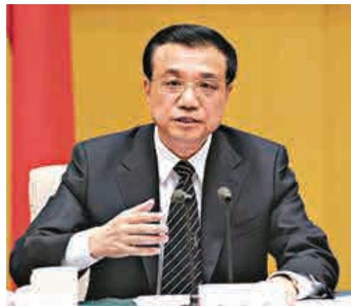
▲國務院總理李克強主持召開國務院常務會議，決定實施普遍性降費，為小微企業減負添力。

另外，會議還確定促進雲計算創新發展的措施，以培育壯大新業態新產業。在疾病防治、災害預防、社會保障、電子政務等領域開展大數據應用示範。加強信息安全評估和防護。