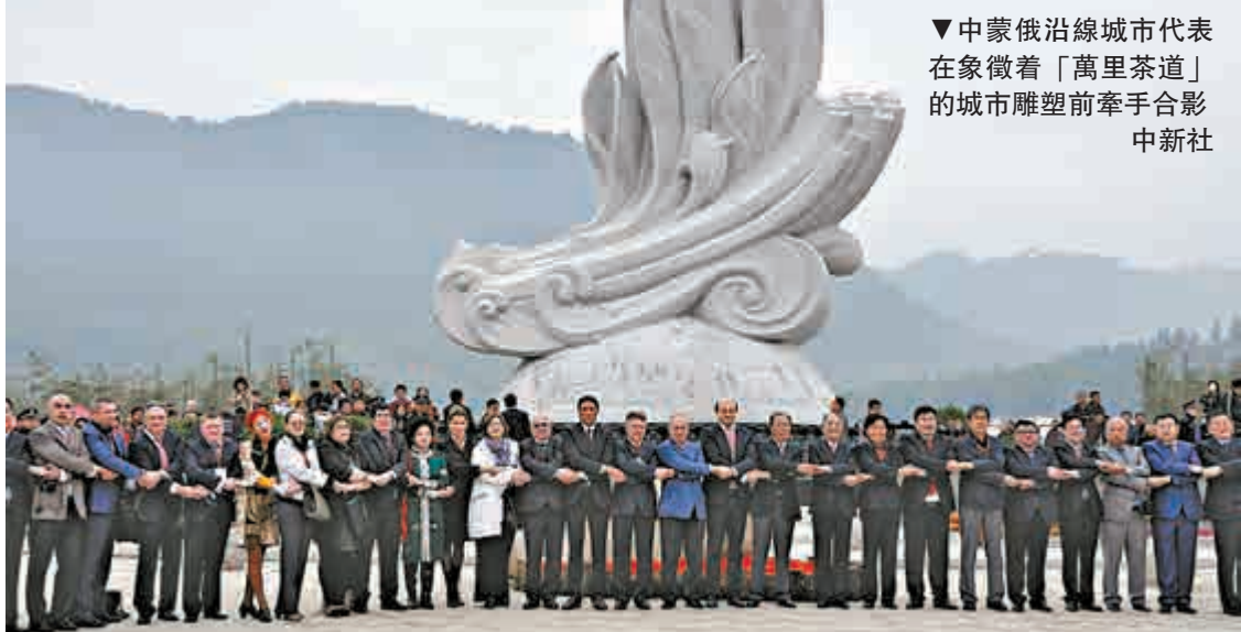
▼中蒙俄沿線城市代表在象徵著「萬里茶道」的城市雕塑前牽手合影。

本屆峰會期間將舉行「萬里茶道」國際聯盟城市市長圓桌會議、「萬里茶道」文化遺產保護利用研討會、「萬里茶道」沿線城市主題交流推介會等多項活動。