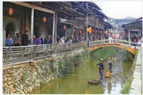
▲茶葉的運輸，讓下梅村與世界聯通，帶動了中蒙俄三國的經貿交流。

茶道起點」八個大字。一入村子，一條貫村而過的小溪映入眼簾。據《崇安縣志》（武夷山市舊稱）記載，200多年前，這條寬約兩米、水深僅十公分左右的小溪曾日行舟300餘艘，滿載着新茶，順信江下鄱陽湖，繼而穿湖出九江口進入長江，遠赴恰克圖。