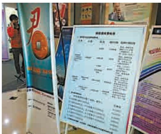
▲內地很多券商都在營業部醒目位置擺放了「滬港通宣傳專欄」

【大公報記者倪巍晨上海電】「滬港通」周一啟動，記者以「港股通」諮詢者身份，在啟動前最後一個交易日分別走訪申銀萬國、國泰君安、海通證券及銀河證券營業網點。儘管散戶們對「滬港通」仍持謹慎樂觀態度，但據本地媒體的消息，當地多家券商開戶數均已接近或超過萬戶。