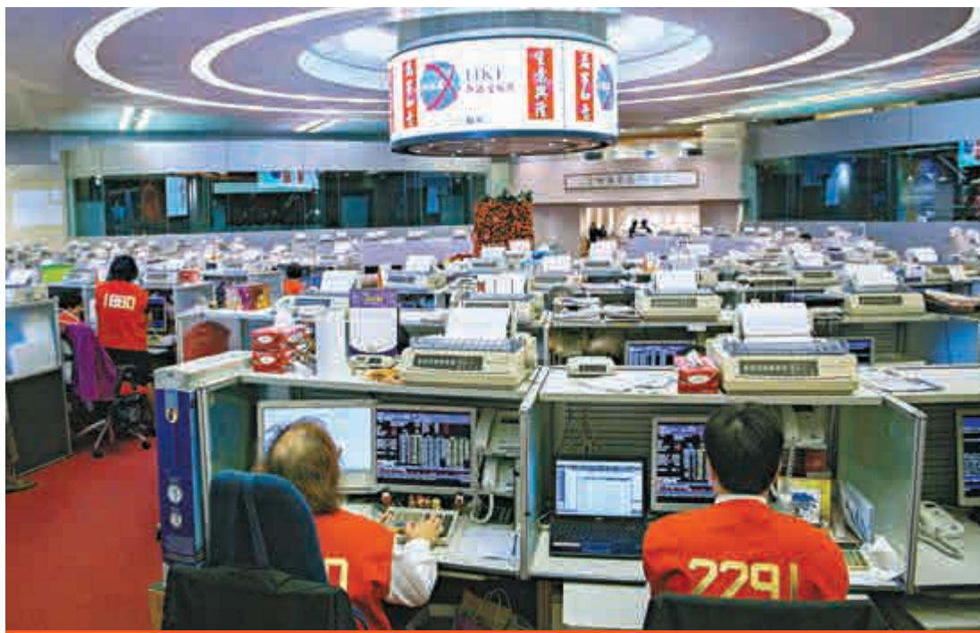
▲滬港通開通後，港股有望成為全球第二大股市