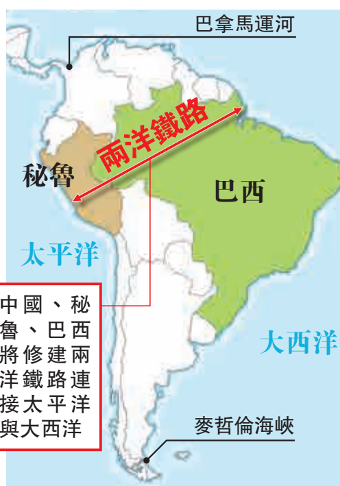
中國、秘魯、巴西將修建兩洋鐵路連接太平洋與大西洋

2014年7月16日，習近平在巴西首都會見秘魯總統烏馬拉，明確表示中國、巴西、秘魯三國將就開展連接大西洋和太平洋的兩洋鐵路合作共同發表聲明，並建議三國組建聯合工作組。