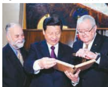
▲2010年6月22日，習近平在訪澳期間出席向澳洲國立大學中華全球研究中心贈書儀式

惠特拉姆今年10月在悉尼辭世，享年98歲。習近平專門向澳洲總督科斯科羅夫致唁電，表示「惠特拉姆先生與世界長辭，不僅使澳洲人民失去了一位傑出政治家，也使中國人民失去了一位好朋友」。