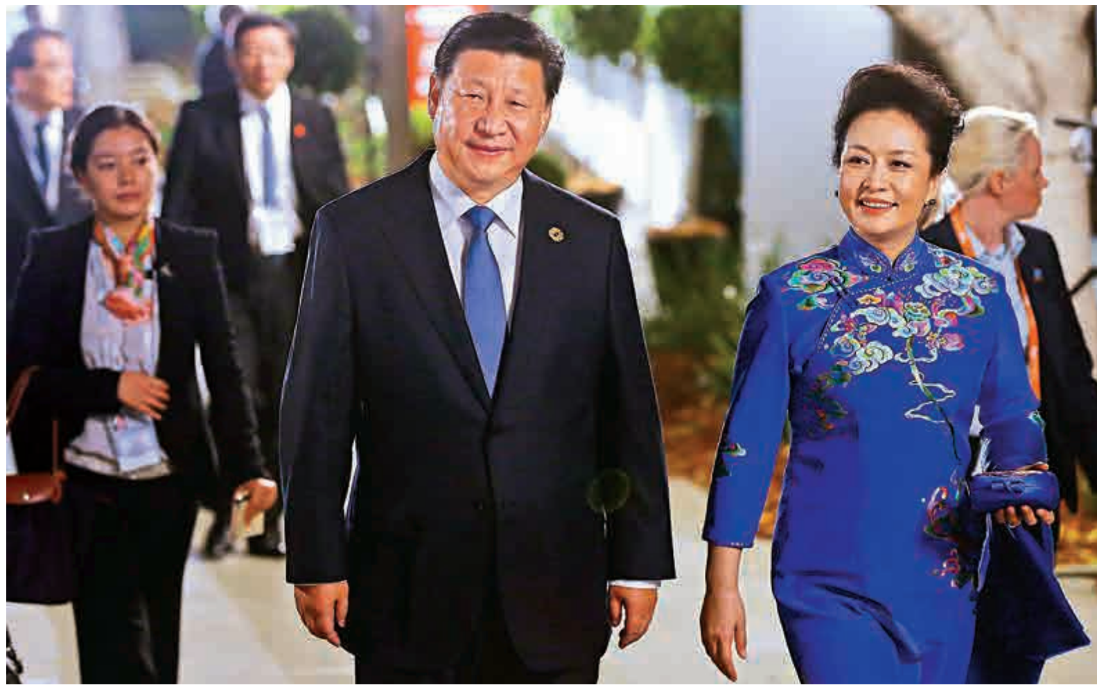
▲習近平伉儷在布里斯班參觀現代藝術館