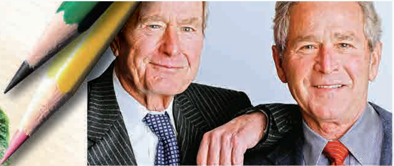
▲小布什(右)老布什父子