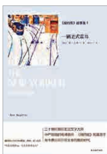
▲《一輛老式雷鳥》封面

上流中產階級的身份重回城郊，與新時代對話。原版《紐約客》故事集》只有一本，以一九七四年發表的《柏拉圖式的戀情》開始，以二〇〇六年發表的《誘鳥》收場。