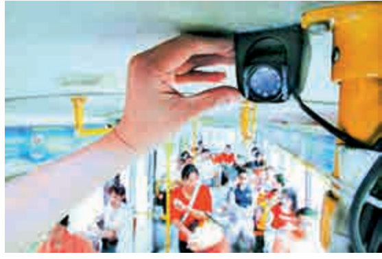
▲內地部分城市公交站安裝攝像頭監控盜竊行為

【大公報訊】據中新社十七日報導：廣州警方17日稱，該市警方近日打掉一個專門在公交站或公車站上盜竊手機的「家族式」特大團夥，抓獲廣西南寧市邕寧籍扒竊團夥20名成員，團夥成員間均為親戚關係。 警方透露，該團夥成員中不乏一些「骨灰」級人物，有的十幾歲就開始混跡廣州，以「摸」、「扒」為生，直至練就一身渾水摸魚的「身手」。多年下來，有的竟然積累了相當豐厚的資產，甚至在廣州買車買樓，定居下來。 為了「拓展業務」，這些骨幹成員開始鼓動家鄉親戚朋友中遊手好閒、而又希望「輕鬆致富」的「同路人」前來「加盟」，自己則當起了「師傅」，作案手法也逐漸演變為結夥、配合的形式，作案地點則主要選擇在廣州天河、黃埔BRT沿線、奧體中心等公車站。 據警方介紹，這些「師傅級」的嫌疑人若親自出手，往往心高氣傲，只訂如iPhone 5S這些新潮機型，不值錢的手機輕易不下手。這些人賺錢容易，花錢也快，他們去一趟娛樂場所，有時一次消費就達萬元人民幣。 10月21日16時，該團夥成員全部進入廣州警方視線，隨着抓捕時機成熟，在確認嫌疑人家族人員全部「到齊」後，抓捕行動小組發出收網信號。幾分鐘內，20名團夥成員被悉數抓獲，警方當場繳獲涉案手機22部。 警方展開審訊，發現這個團夥不僅流竄作案時間跨度長，而且作案累累，涉及多個不同地域。