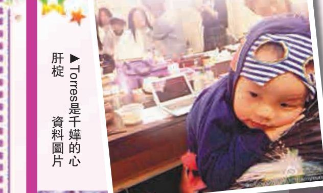
肝旋 資料圖片 Torres是千嬅的心

楊千嬅昨為明年舉辦的演唱會《Let's Begin》舉行記者會，暫定明年1月24至28日在紅館舉行，由於內部認購反應熱烈，早前已宣布加開一場。千嬅出場前，大會安排一位可愛的小妹妹扮成「小千嬅」出場跳舞，又回顧千嬅入行二十年來的成就。