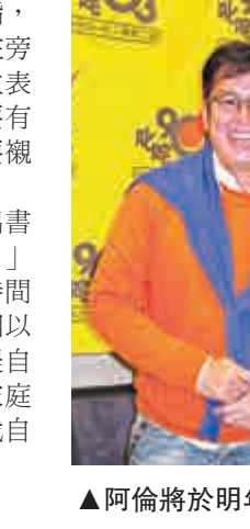
阿倫將於明年出自傳

阿倫又笑言會出寫真，說：「係出書，自傳。我會口述，但傳真都好高。」他指，為了這本自傳，之前花了六天時間做訪問，每天六小時；並坦言，要找回以前的回憶，很多都忘記了，要其他人提自己，亦會找一些舊相配合。問到會有家庭照嗎？他笑說：「我同我阿爸那些？我自己那些，當然無啦。」