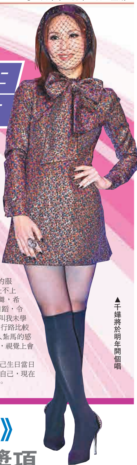
千嬅將於明年開個唱

另外，千嬅願望加場加到自己生日當日（2月3日），以往場數是想挑戰自己，現在希望唱一場滿一場，就非常開心。