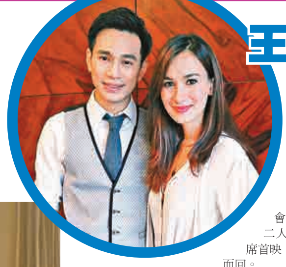
王梓軒（左）與Celina Jade 出發到越南參加電影節