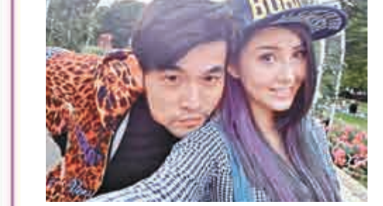
周董（左）公開與昆凌的合照，相信二人婚期不遠矣

現年35歲的台灣歌手周杰伦（周董），與21歲混血兒女友昆凌拍拖三年，二人一直未有公開承認戀人關係，就算被拍到行街拍拖，周董也總是戴着面罩，二人亦從未在社交網上晒合照。不過，昨日凌晨3點，周董在馬來西亞舉行完演唱會後，突然透過「MRJ台灣官方」專頁上載2張與昆凌的親密合照，並感性寫道：「昨天辦完演唱會，收到了許多歌迷的祝賀，希望我幸福快樂，看到你們有些帶著小孩全家大小來看演唱會，與我分享你們的喜悅，我很感動，14年了，也該我與你們分享我的喜悅了。」