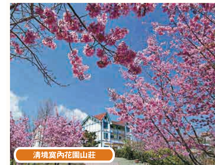
清境寔內花園山莊