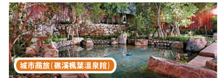
城市商旅 (礁溪楓葉溫泉館)

【大公報訊】納斯達克上市公司Priceline集團旗下、全球網路訂房領導品牌Agoda.com，18日公布被譽為全球傑出飯店指標獎項的「Agoda.com金環獎」(Gold Circle Awards)，今年台灣共有多達30間酒店及民宿獲獎，較去年多出10間；不僅如此，今年更有來自宜蘭及府城台南的酒店首度進榜為台爭光。據中時電子報報道，Agoda.com的金環獎評選標準相當嚴謹，根據顧客於退房後所提交的住宿評鑑、價格競爭力，以及飯店是否充分利用Agoda.com所提供的後台管理系統來優化訂房資訊並有效管理訂單……等各個面向的表現後，再進行綜合評比，並挑選出年度傑出得獎飯店。