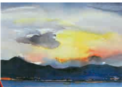
▲陸浩榮水彩作品《與大自然接觸》