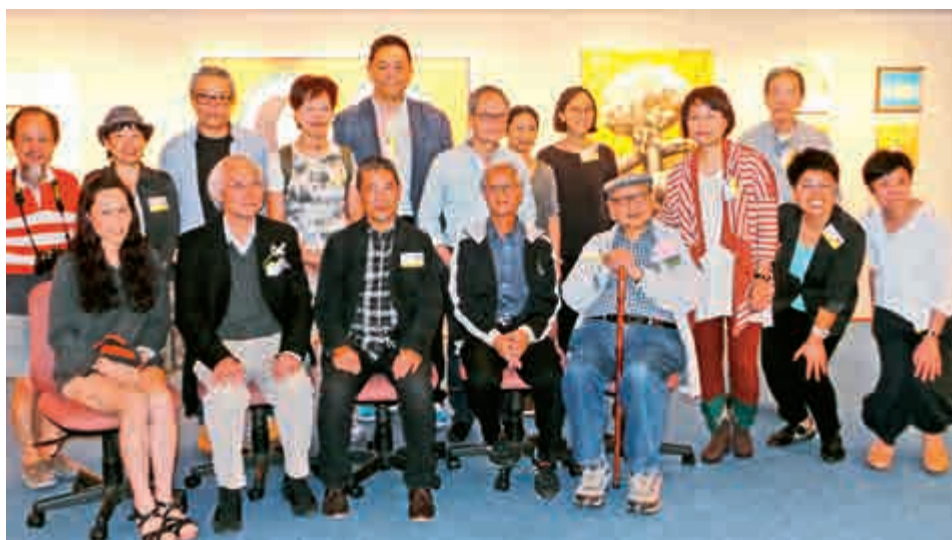
藝緣畫會成員與主禮嘉賓於開幕式合影