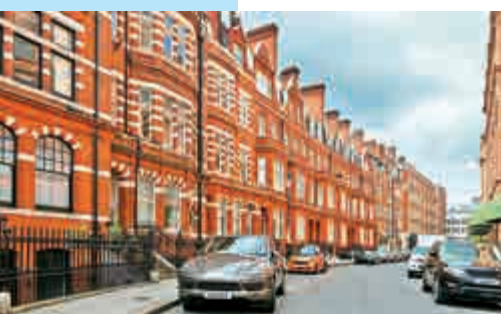
▲倫敦樓價自金融海嘯以來已升超過三成