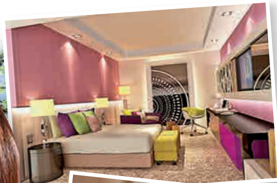
◀酒店保留了建築物的歷史風貌