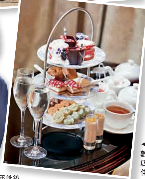
◀帝盛在倫敦的首家酒店推出美酒佳餚