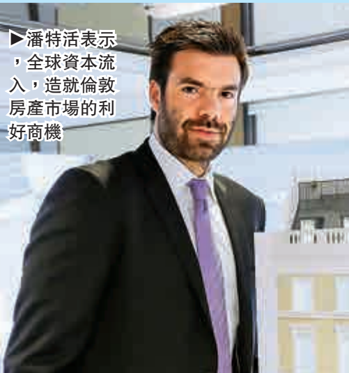
▶潘特活表示，全球資本流入，造就倫敦房產市場的利好商機