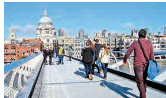
▲不少海外投資者到倫敦買樓，令樓價持續向上

潘特活又認為，有更多鍾情於倫敦豪宅的買家，將視線轉移至價值150萬鎊的物業，加上本地的持續性強勁需求，相信倫敦樓價表現將優於整體市場。此外，政府推出協助買家敘造按揭貸款上車置業的計劃，增強了買家的信心和購買力，為一般住宅市場帶來明顯的支持作用，料未來更為活躍。簡而言之，倫敦作為環球性市場，也是居住和從商的理想地，待徵稅措施和大選辯論一旦過去，他預期倫敦樓市將再度蓬勃，惟未來一至兩年將較往年放緩。