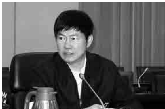
▲福州市長楊益民向涉外媒體記者介紹福州建設海上絲綢戰略樞紐城市的情況