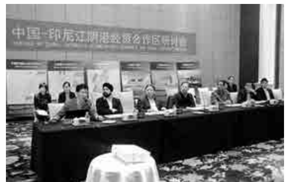
▲在融僑集團舉辦的中國-印尼江陰港經貿合作區研討會上，中國與印尼兩國商界人士探討構建對接式自貿園區的可行性及項目準備。圖中前排右三為時任印尼駐華大使易慕龍，前排中為融僑集團總裁林宏修

據楊益民市長透露：福州自貿區的面積為51.36平方公里，由福州保稅區、福州(江陰)保稅港區、福州(江陰)出口加工區等幾個海關特殊監管區，以及馬尾經濟技術開發區、臨空經濟區、福州海峽金融實驗區、中央商務區等組成。目前正組織研究上海自貿區運作模式，還將學習借鑒國外自貿區的運作模式，先克隆再結合實際情況，爭取創造出符合福州特點的自貿區模式。據悉，福州市擬在福清江陰港區打造與東盟國家對接式自貿園區，推進礦產、冶金、石化、天然氣資源、半成品的儲運和深加工及機械製造業領域的合作。