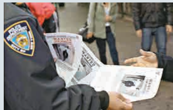
▲紐約警察在地鐵站發放疑犯的通緝令