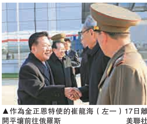
▲作為金正恩特使的崔龍海（左一）17日離開平壤前往俄羅斯

崔龍海17日起對俄羅斯進行為期7天的訪問。因為延誤，崔龍海抵達莫斯科比原定時間晚10個小時。崔龍海對莫斯科進行為期三天左右的訪問，之後他還將訪問俄羅斯遠東城市哈巴