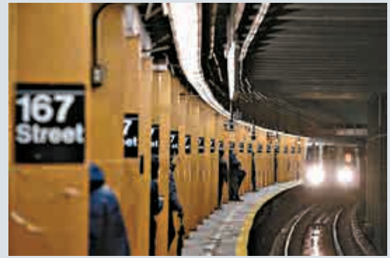
▲發生推人落軌慘案的167街地鐵站