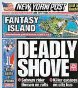
▲《紐約郵報》17日頭版報導港移民被推落地鐵事件

紐約乘客權益公益維護組織表示，雖然上述的問題確實存在，但仍然可以尋找替代方案，譬如使用較便宜的「入侵探測」技術來保證安全——在鐵路路軌上有人侵入的時候，該探測系統會發出警報。