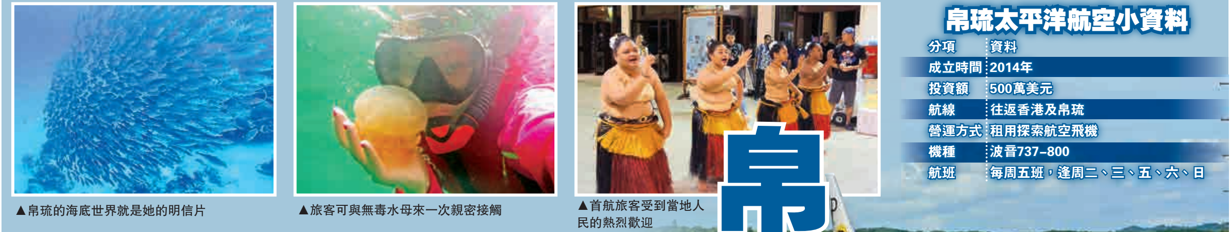
▲ 帛琉的海底世界就是她的明信片 ▲ 旅客可與無毒水母來一次親密接觸 ▲ 首航旅客受到當地人民的熱烈歡迎

如果你嚮往真正純淨的海水，那麼帛琉將是你夢寐以求的天堂。20年前，百悅旅遊集團董事長邱宏照到帛琉旅遊，從此對它「念念不忘」。為了發展當地旅遊業，他近期斥資500萬美元成立帛琉太平洋航空（PPA），冀能提供一條龍旅遊服務，未來還將投資地產和金融業，打造「度假中心」和「金融中心」。他透露，至今已於當地累積投資1500萬美元（約1.17億港元），是對帛琉貢獻最大的華人，目標做「帛琉李嘉誠」。