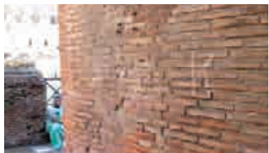
▲一名俄羅斯遊客在牆壁上留下的英文字母「K」的塗鴉 互聯網

【大公報訊】據法新社22日消息：22日，一名俄羅斯遊客被抓到在意大利著名景點羅馬鬥獸場的牆面上塗鴉，遭到高達兩萬歐元（約19.2萬港幣）的重罰。