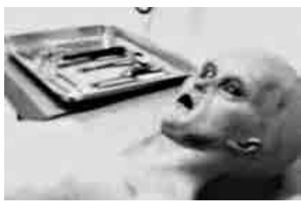
▲拍攝時間遠至 1947 年的外星人遺體解剖照