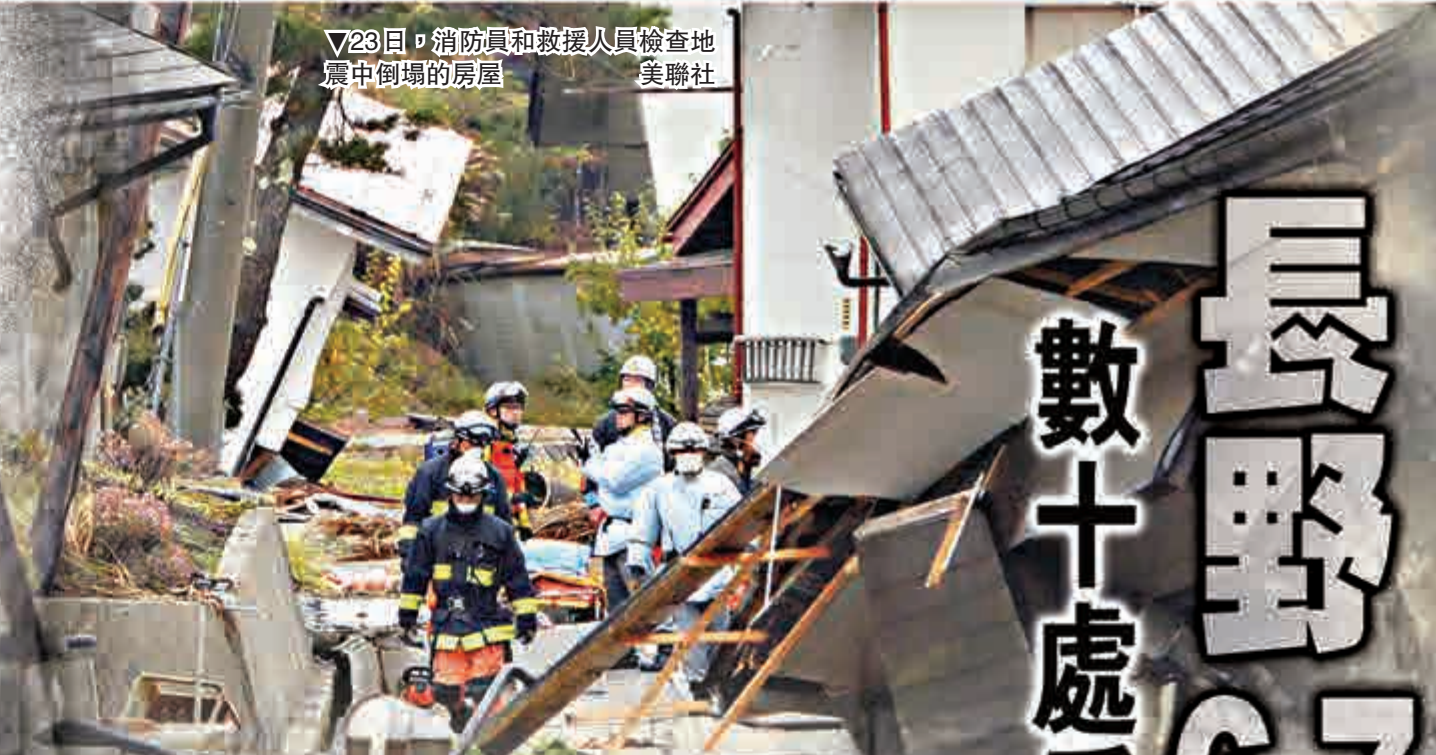
▽23日，消防員和救援人員檢查地震中倒塌的房屋

但仍有入認為照片造假，《海恩斯不明飛行物體調查手冊》的作者沃森說：「如果真的發現外星人，那將是改變世界的大事，我不能想像在整個1950及60年代可以隱瞞這樣的事。」