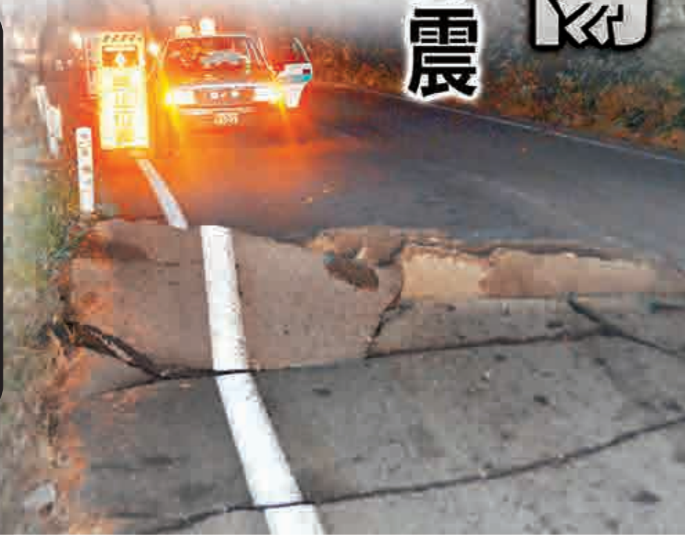
▶從白馬村到長野市的公路於22日的地震中受損