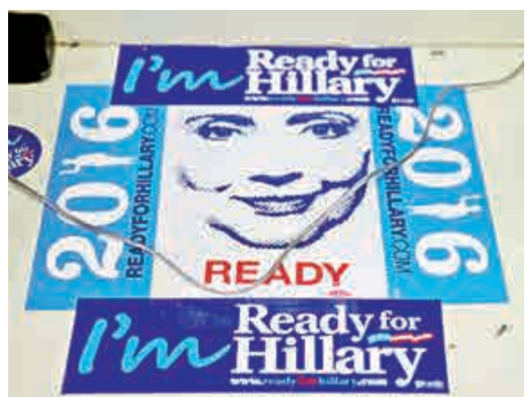
▲支持希拉里2016年參選總統的海報

普京談及「石油陰謀」時說，來自於美國、利比亞、伊拉克、沙特阿拉伯，甚或是「伊斯蘭國」(ISIS)的石油大量增產，這些國家「同流合污刻意拉低油價，企圖打擊俄羅斯石油出口收入」，現在油價已經降到每桶80美元以下，這是盧布貶值的原因之一，長遠來看，受傷的其實是全球經濟。俄羅斯財長安東·西盧安諾夫24日表示：「因為歐美制裁，我們每年損失約為400億美元(約3100億港元)，而由於油價暴跌了30%，我們每年的損失在900億至1000億美元(約7750億港元)。」