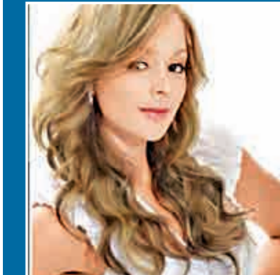
▲疑似普京女兒葉卡捷琳娜(左圖)和瑪麗亞(右圖左)的照片在網上流傳