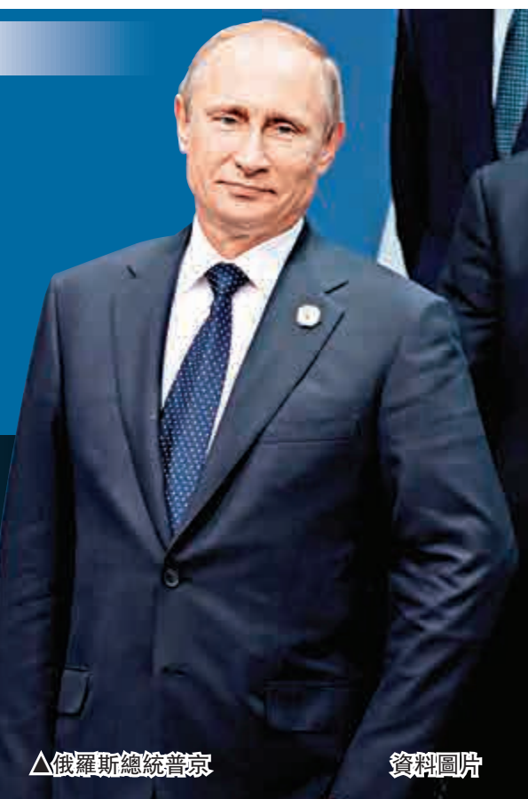
▲俄羅斯總統普京 資料圖片