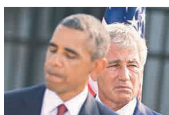
▲美國總統奧巴馬(前)即將宣布防長哈格爾(後)辭職