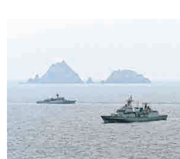
▲韓國海軍24日在獨島進行軍事演習

賽門鐵克認為這與另外一種電腦病毒Stuxnet有相似之處，這是一種美國和以色列研發的病毒軟件，意在針對伊朗的核項目。