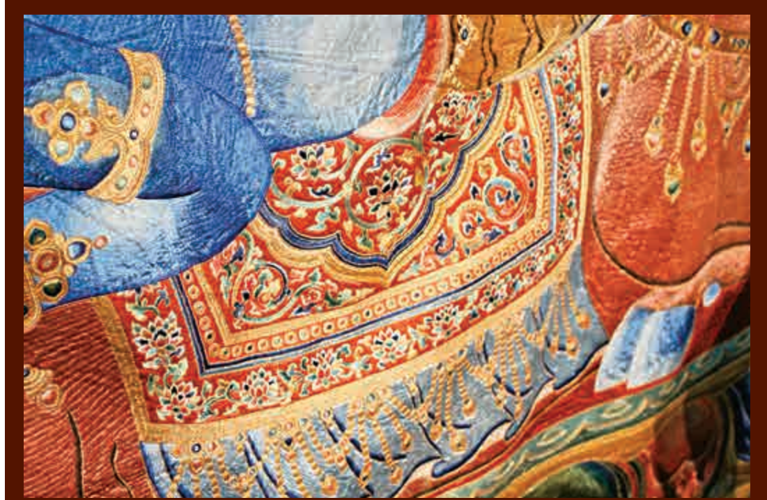
▲裝飾紋飾有明朝宮廷的特色