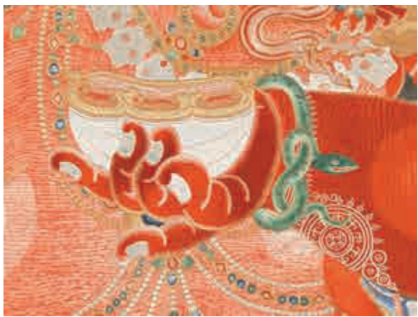
▲紅閻摩敵手持嘎巴拉盤

五世噶瑪巴應永樂帝的邀請，為太后作超薦法事。皇帝和皇后亦接受法王的灌頂。一年後，德新謝巴辭別永樂帝回到西藏。皇帝贈送了大批精美的禮物。此後，皇帝亦多次遣人赴藏。據載：「永樂十七年（1419）十月癸未，遣中官楊英等齎敕往賜烏思藏」（《明太宗實錄》卷一一四）。這個使團據說由一百二十人組成，帶來了很多珍貴禮物。