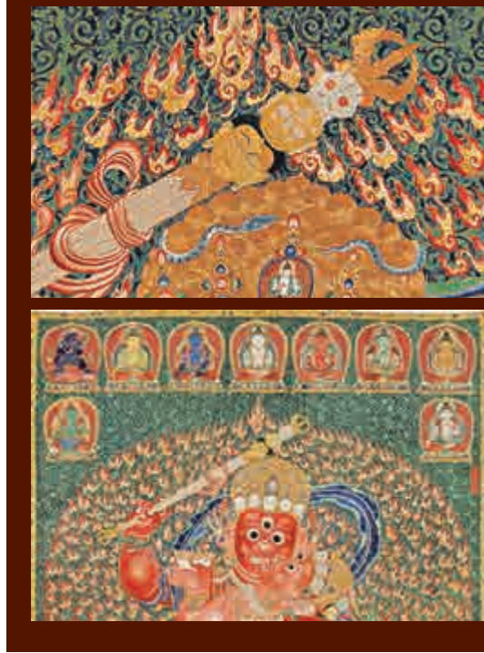
▲權杖上有從生到死三張面孔