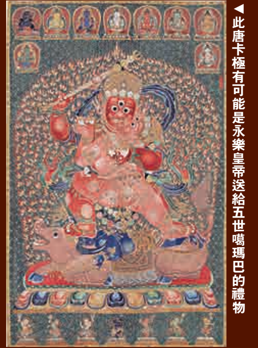
▲此唐卡極有可能是永樂皇帝送給五世噶瑪巴的禮物

在這些禮物中，少不了精美的唐卡。現在在西藏拉薩大昭寺，珍藏有兩幅明代刺繡唐卡，上面也有「大明永樂年施」六字題款。一幅畫面為「第恰」（勝樂金剛），另一幅為「傑吉」（大威德）。